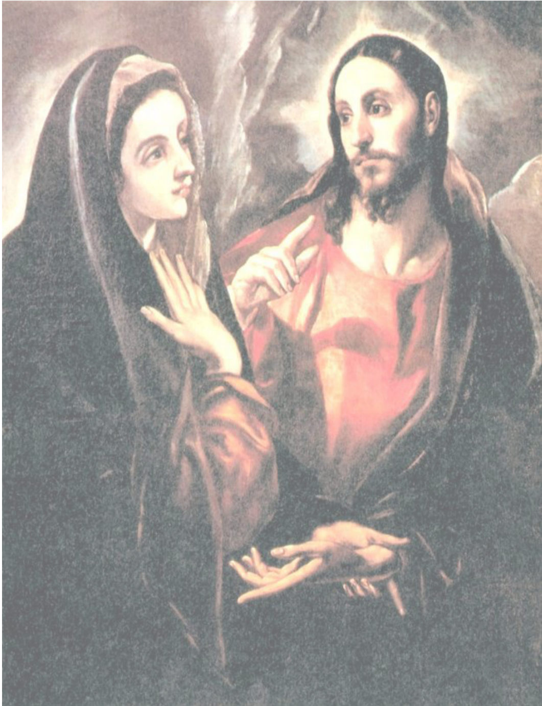
Cristo risorto appare a Maria, di El Greco, 1600-1608, Museo della cattedrale di Toledo

Questo dipinto rappresenta un incontro carico di intensità tra Cristo e la Vergine. Lo stile è tipico di El Greco: figure allungate, volti espressivi, luce irrealistica che sembra provenire dall'interno dei personaggi più che dall'esterno. I colori sono caldi ma drammatici: il rosso della veste di Cristo richiama il sacrificio, mentre il velo scuro della donna suggerisce dolore, raccoglimento, attesa.