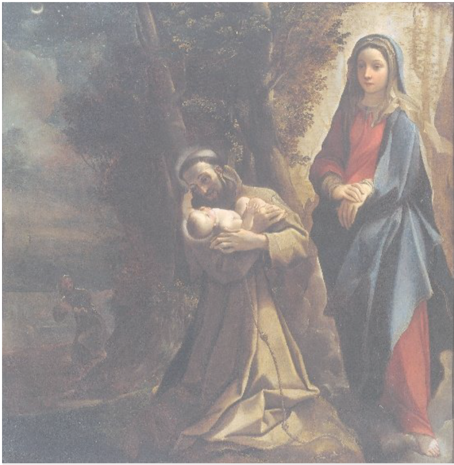
La visione di san Francesco d'Assisi, 1583-1585, Ludovico Carracci, Museo di Amsterdam

Il dipinto che contempliamo questa settimana ci introduce con delicatezza nel cuore della spiritualità francescana. In una scena immersa nel silenzio della notte, san Francesco appare inginocchiato mentre stringe tra le braccia il Bambino Gesù, dono celeste che gli viene affidato dalla Vergine Maria, raffigurata accanto a lui in atteggiamento raccolto e materno. La luce che avvolge la Madonna e il Figlio contrasta con il paesaggio ombroso circostante: è la luce della grazia che rischiara il mondo e il cuore dell'uomo. Il saio povero del Santo, la sua espressione colma di stupore e tenerezza, rivelano tutta la profondità del suo amore per il mistero dell'Incarnazione.