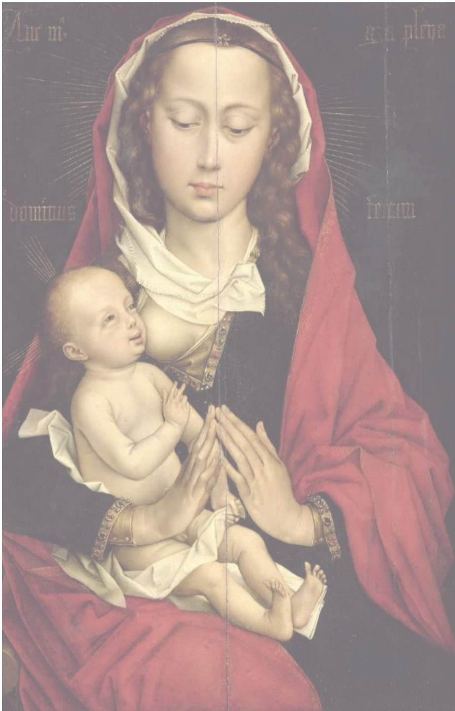
La Vergine con il Bambino, 1460 circa, di Roger Van Der Weyden, Musée des Beaux-Arts di Caen

Davanti allo splendido capolavoro della scuola di Rogier van der Weyden, siamo invitati a compiere un viaggio del cuore: dal calore del grembo materno al mistero dell'Altare. Questa immagine è una meravigliosa preparazione visiva alle nostre Giornate Eucaristiche.