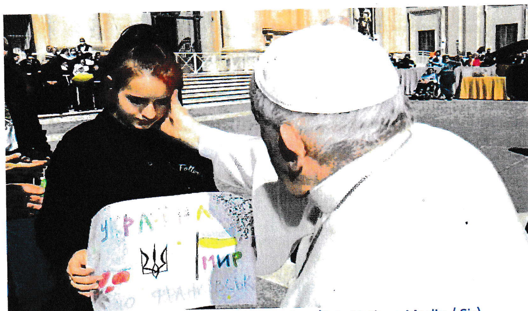
Papa Francesco con una giovanissima ucraina