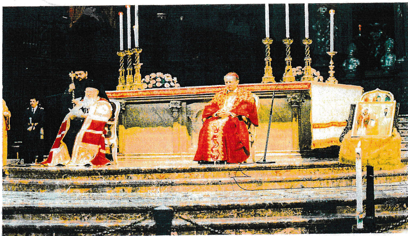
Il Cardinale in Duomo con il Patriarca di Costantinopoli Bartolomeo I in occasione della Pentecoste del 1997