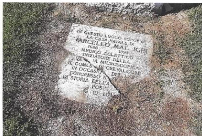
Cippo casa natale di M. Malpighi

via Via Muzza Nord n. 4522 (via per Camposanto)