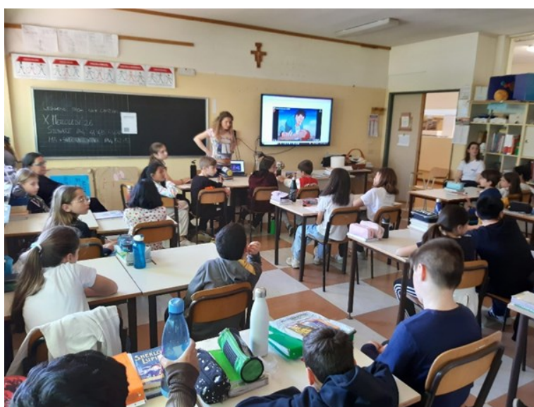
Foto di fine anno scolastico

I ragazzi hanno interagito positivamente gratificandoci per l'impegno che ormai da molti anni dedichiamo a questo progetto. Siamo certi che molti giovani, che nel corso degli anni sono diventati Donatori di Sangue, hanno maturato questa decisione facendo germogliare quel "seme" che abbiamo seminato con i nostri incontri. Per tale motivo, e con questa convinzione, continueremo a farlo.