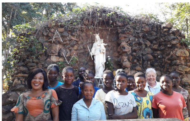
Un gruppo di ragazze a Kasenga con la statua di Maria Ausiliatrice che onorano particolarmente nel mese di maggio