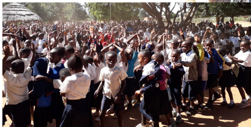
I bambini della scuola elementare