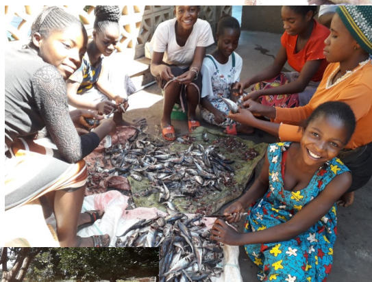
Un gruppo di ragazze che aiutano con disponibilità e gioia per la mensa