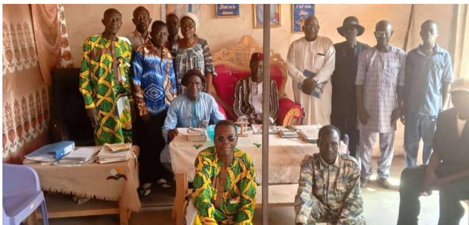
Photo4 : Réunion de mobilisation des chefs de quartiers et carrés pour la fréquentation du centre

Le donne sono la maggior parte di quelle che incontriamo nella sezione di prevenzione, poiché sono le più coinvolte nella vaccinazione durante le visite prenatali. Sono anche quelle che portano i loro bambini al centro per la vaccinazione. La vaccinazione è gratuita, in quanto sovvenzionata dal governo ciadiano. Nonostante queste persone siano state raggiunte nell'ambito della campagna di sensibilizzazione, il loro numero è ancora basso: meno del 5% della popolazione totale è stato raggiunto.