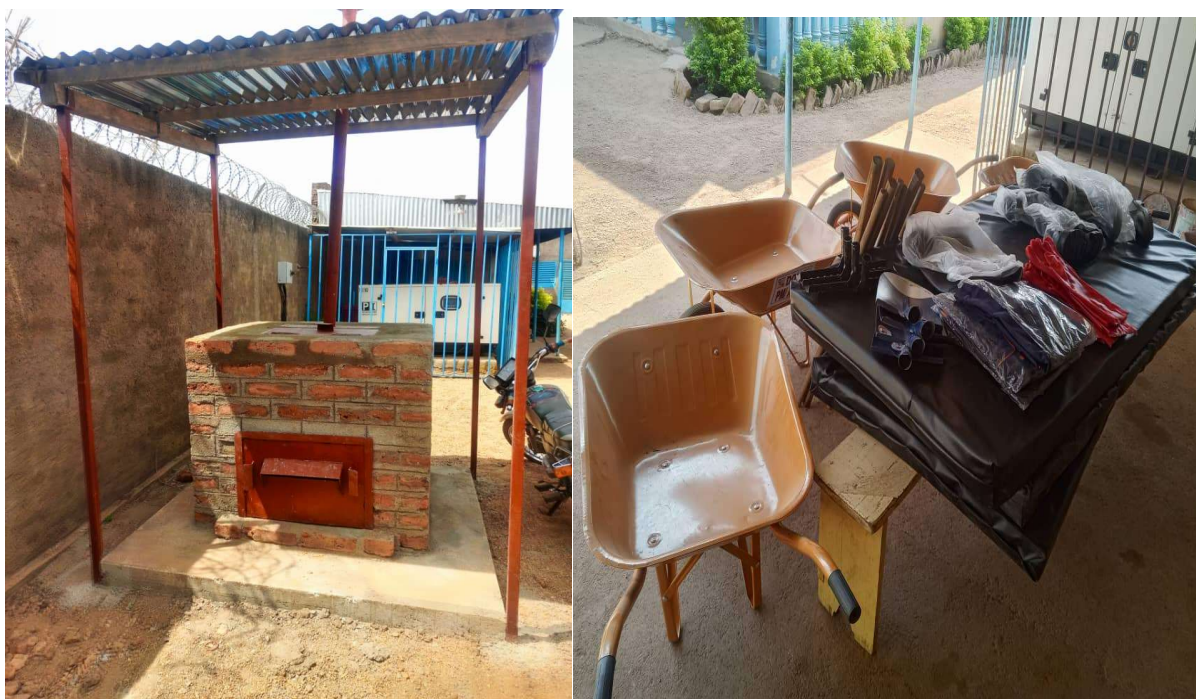
Photo5 et 6 : Incinérateur et autres matériels offerts au centre par association « Moundou Poitier »