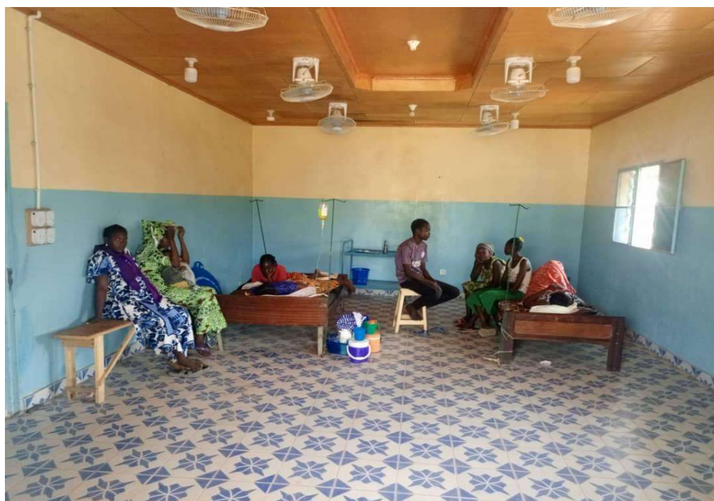
Photo1 : patients sous observation dans la salle de garde au centre

Queste due malattie si ripresentano spesso perché la città di Moundou è una zona endemica per la malaria; c'è anche un problema di igiene a livello domestico: le persone mangiano verdure crude senza lavarle con la candeggina.