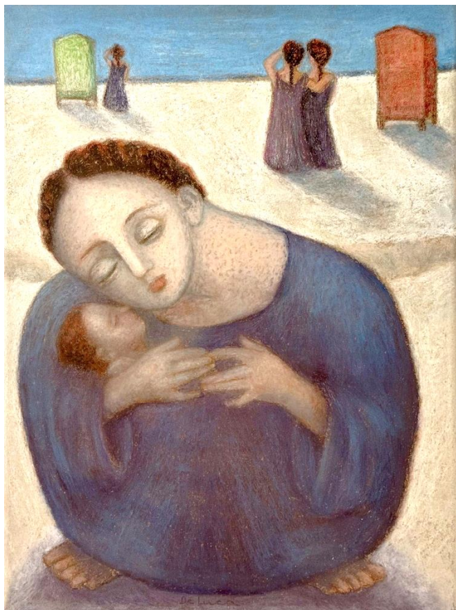
(Elio De Luca, "Natività")

Padre che sei nei cieli, la fede che ci hai donato nel tuo figlio Gesù Cristo, nostro fratello, e la fiamma di carità effusa nei nostri cuori dallo Spirito Santo, ridestino in noi, la beata speranza per l'avvento del tuo Regno.