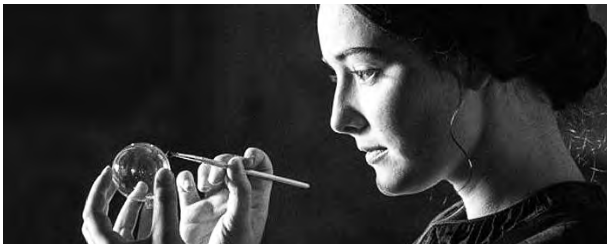
La soffiatrice di vetro. La genialità del cuore

La sezione dei viaggi all'estero si apre con il ricordo del canto poetico sulle cui note siamo nati, come libreria della poesia prima, come libreria del viaggio e come tour operator poi. Le nostre proposte suggeriscono che il viaggio sia davvero per gli studenti la scoperta di una dimensione non banale, non condizionata da rigidità organizzative: auspichiamo che esso nasca dalla programmazione e dall'amore. Ecco dunque, ad esempio, i nostri Grandi Viaggi in pullman lungo le strade d'Europa, ecco l'antico e sempre nuovo richiamo alle Capitali d'Europa , le Città Preziose .