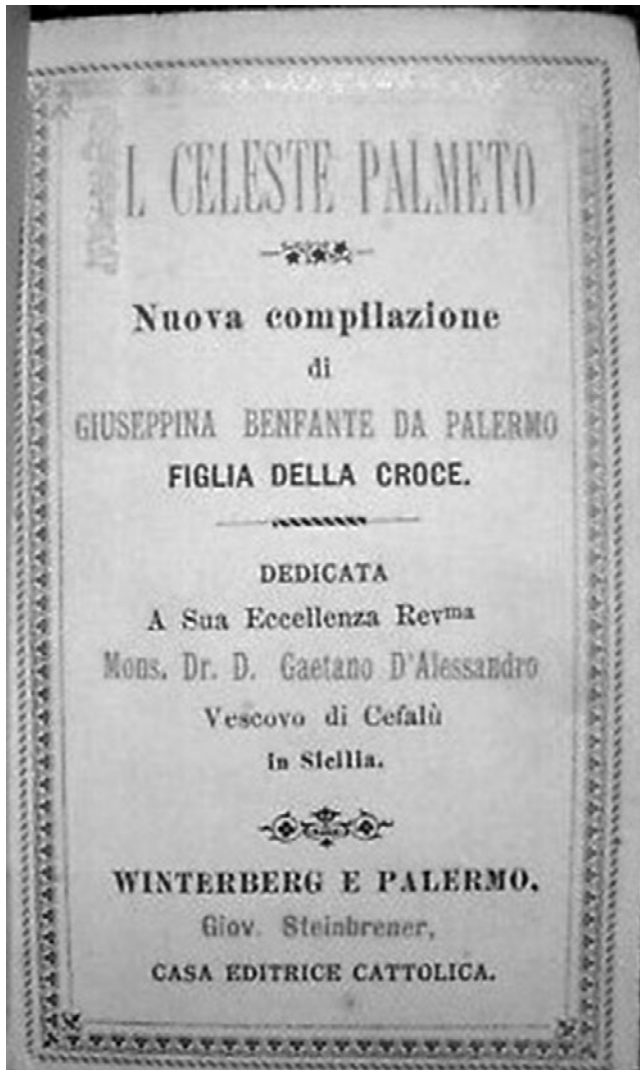
G. Benfante, Il celeste palmeto , Steinbrener, Winterberg e Palermo 1892