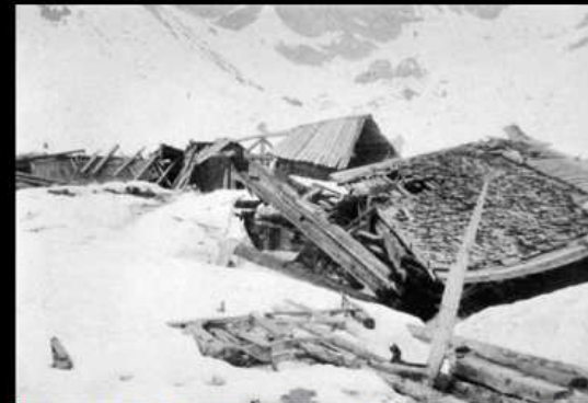
Baracche distrutte dalle valanghe a Fuciade (9 marzo 1916)

Il posto, posto fra l'erba ma recintato, si intravede il cippo che sanciva l'antico confine fra