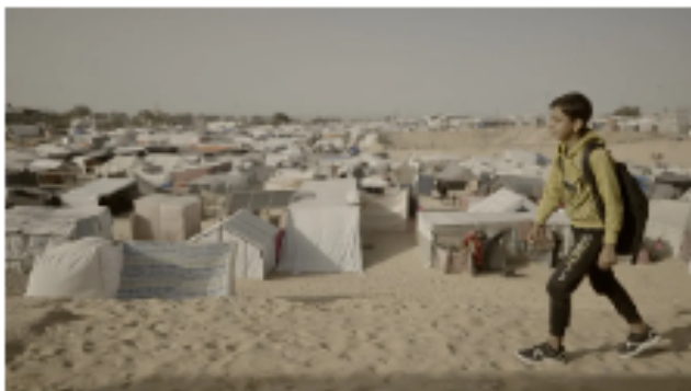
Un'immagine da «From Ground Zero»

CINEMA. Il Festival di Ancona, dedicato al formato breve, ha presentato «From Ground Zero», film collettivo nel quadrilogo della Striscia in macerie coordinato da Rashid Masharawi. Fra gli ospiti, Nanni Moretti