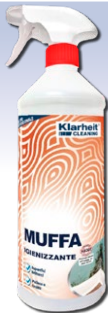
SPRAY MUFFA 1Kg art. KLC TM1