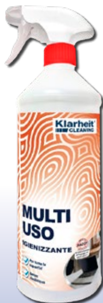
SPRAY MULTIUSO igienizzante 1Kg