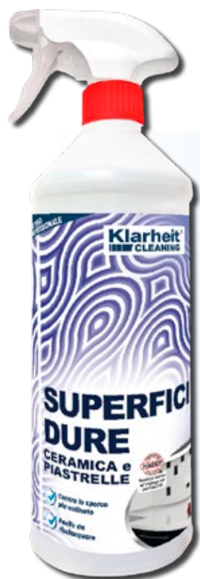
SPRAY CERAMICA e PIASTRELLE 1 Kg art. KLC TP1