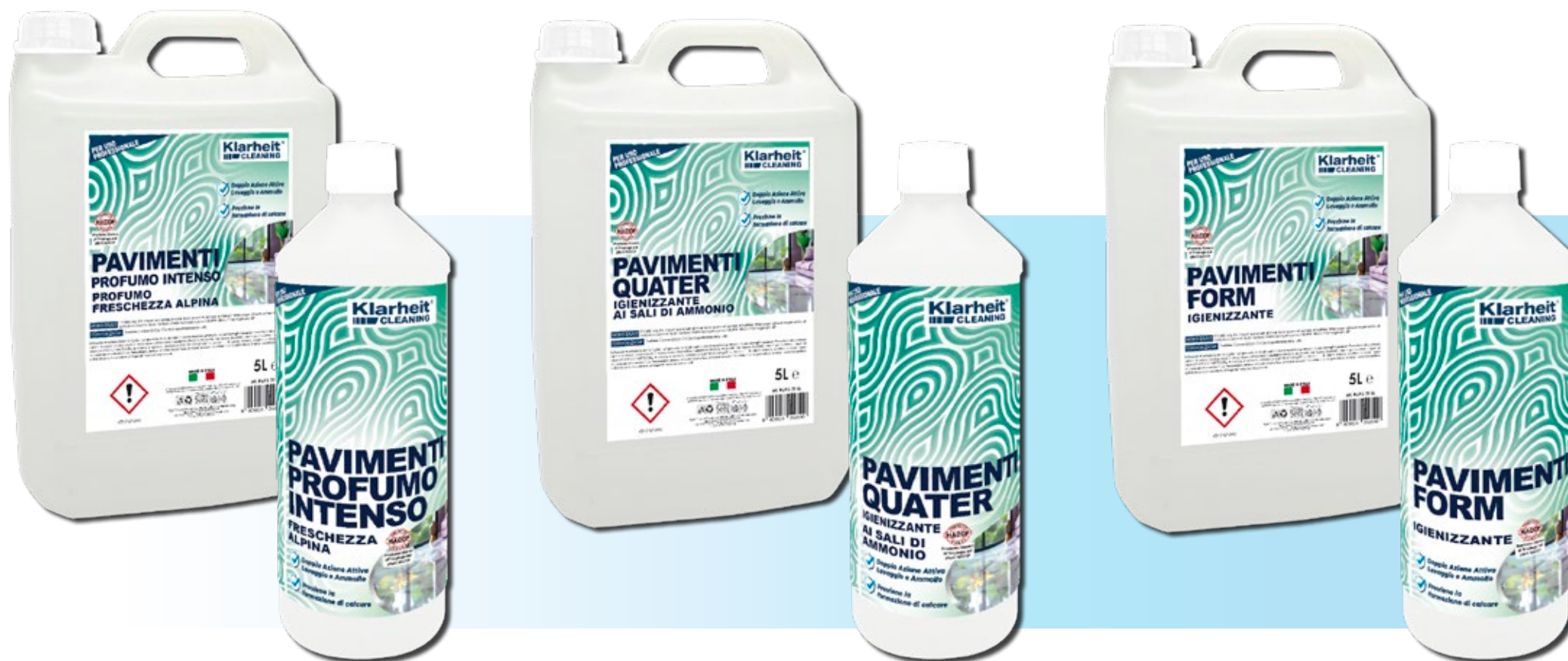
DET. PAVIMENTI prof. FRESCH. ALPINA INTENSO 5 Kg art. KLC PHF5