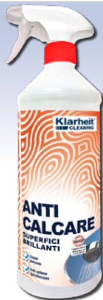
SPRAY ANTICALCARE 1Kg