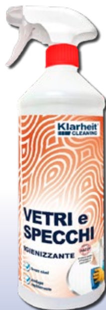
SPRAY VETRI e SPECCHI igienizzante 1Kg