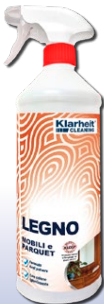
SPRAY LEGNO mobili e parquet 1Kg