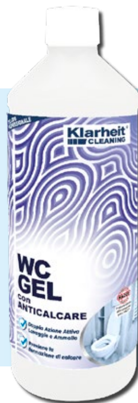
WC GEL con anticalcare 1 Kg art. KLCW1