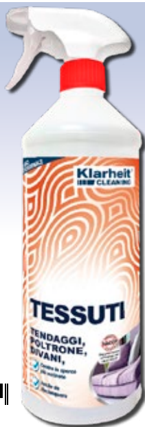
SPRAY TESSUTI 1Kg art. KLC TT1