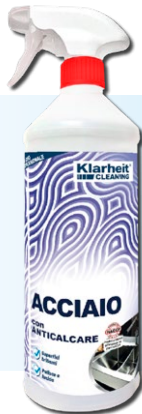
SPRAY ACCIAIO con anticalcare 1 Kg art. KLC TA1