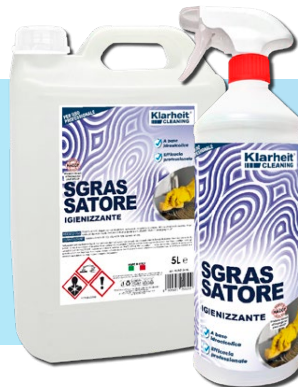
SGRASSATORE IGIENIZZANTE 5 Kg art. KLC SI5