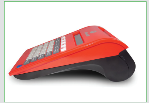
Forma compatta, linee curate e moderne