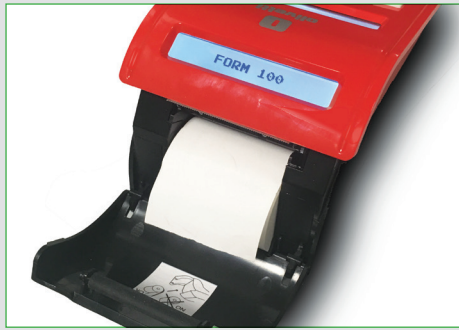
Inserimento rapido e agevole del rotolo carta