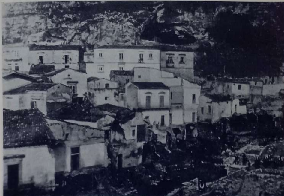
Ecco come appariva la parte bassa del quartiere «Vausu» l'indomani dell'alluvione. Su quest'angolo si è abbattuta la furia tremenda della fiumana proveniente dalla Fontana di S. Pancrazio.

In tanta tristezza è supremo conforto vedere i bravi soldati del 20° Fanteria ed i reali carabinieri che lavorano nell'acqua, sereni ed infaticabili, agli ordini dei loro ufficiali.