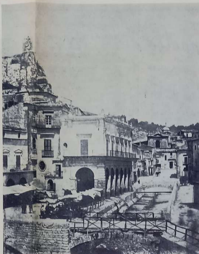
Il fango è già stato tolto dalle strade e la città riprende il suo aspetto normale. Il tratto di alveo scoperchiato dalla terribile pressione dell'acqua dovrà aspettare parecchi anni prima di essere ricostruito. La piazzetta torna ad essere occupata dalle bancarelle dei venditori ambulanti. Siamo nell'estate del 1963.

Ora non c'è più fretta, il silenzio si è sostituito al frastuono ed il pianto, alle invocazioni di soccorso. L'alveo è asciutto e si va riempendo dei detriti che vengono fuori dalle case. In piazza Mazzini, un carro dalle ruote contorte, punta le due aste contro il cielo come un moto (gesto) di accusa.