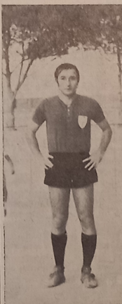
REGALINO: anche a Barcellona sostituirà Metafo nel ruolo di stopper.

L'avversario di turno è la Nuova Igea. Una squadra non nuova per questo girone di serie D. Da alcuni anni è stata una testa di serie tra le candidate alla promozione e da qualche campionato ha dovuto fare un po' di anticamera. Quest'anno è ancora una delle squadre da battere e l'avversario giusto potrebbe essere il... Modica! L'incontro non ha una vera e propria tradizione: la Nuova Igea e il Modica hanno