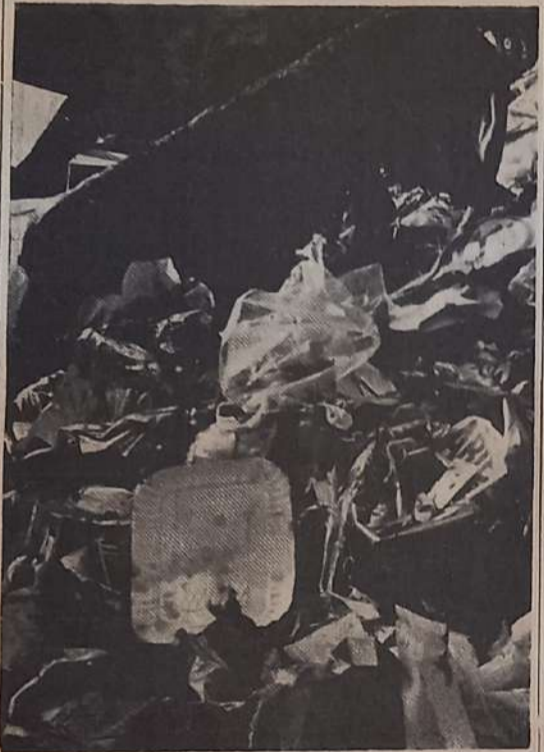
Cani e immondizie in una via di Modica

e nauseante che si offre ogni giorno ai modicani e, quel che è più grave, ai forestieri.