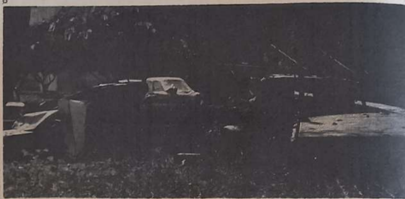
Proprio in questi giorni il Comando dei Vigili Urbani ha disposto la rimozione di tutte le carcasse d'auto esistenti nell'abitato. Il lavoro procede molto lentamente e si augura che al più presto venga esteso in tutti i quartieri, onde eliminare l'indeciso spettacolo che il «cimitero delle automobili» offre soprattutto ai vicinisti. Nella foto di Franco Ruta alcuni relitti d'auto nel lato nord di S. Francesco la cava, destinato a divenire villa comunale (sic!).