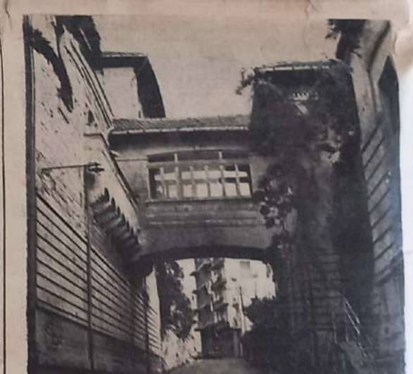
Il locali della villa Cascino che in un prossimo futuro dovrebbero ospitare il Liceo Scientifico di Modica.

le autorità scolastiche e con gli studenti, è stato quello del trasferimento in blocco di tutte le undici classi (circa 240 alunni) nei locali dell'ex Sanatorio Cascino, in via Nuova S. Antonio. L'ente proprietario dello edificio, con annesso parco, è l'ONMI che avrebbe dovuto realizzare a Modica un «asilo-nido», divenuto ora ziate e invece ancora Scifo deve studiare il sistema idoneo per reperire questi cinque milioni. Che ne sarà allora nel '70 dei ragazzi dello «Scientifico»? Saranno ospiti del vecchio Sanatorio o rimarranno in mezzo alla «strada»? E' quello che ci piacerebbe sapere anzitempo.