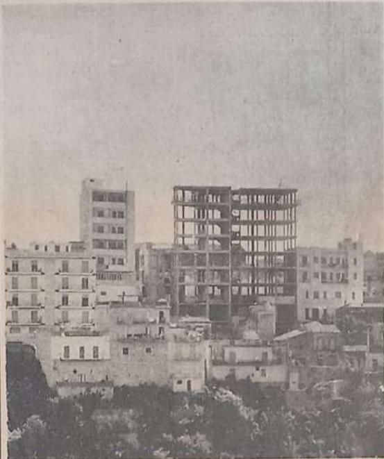
G. B.

I dati raccolti nel lontano 1956 risultano infatti, inadeguati e per niente aderenti alla nuova realtà L'«equipe» dei tecnici deve assolutamente rivedere gli studi prima di presentare il piano al Sindaco