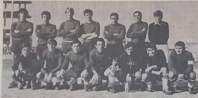
Una recente formazione del Modica.

Oggi, infatti, malgrado la palla come si suol dire è rotonda, saranno di fronte capolista e fanalino di coda. Per il Modica non c'è bisogno di ripetere il discorso