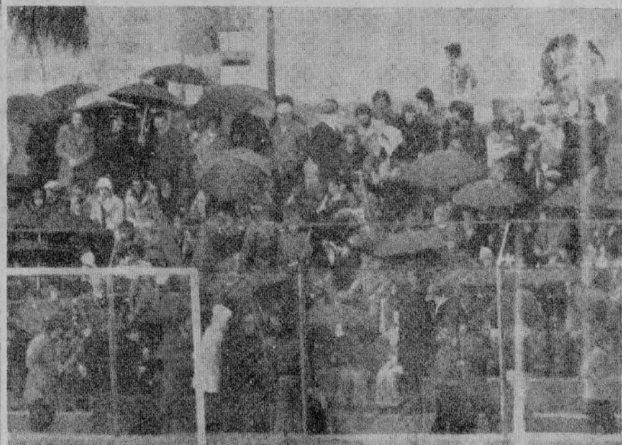
Il meraviglioso pubblico sportivo modicano sugli spalti della «C» al «V. Barone», durante la partita Modica-N. Igea — Servizio nelle pagine interne.