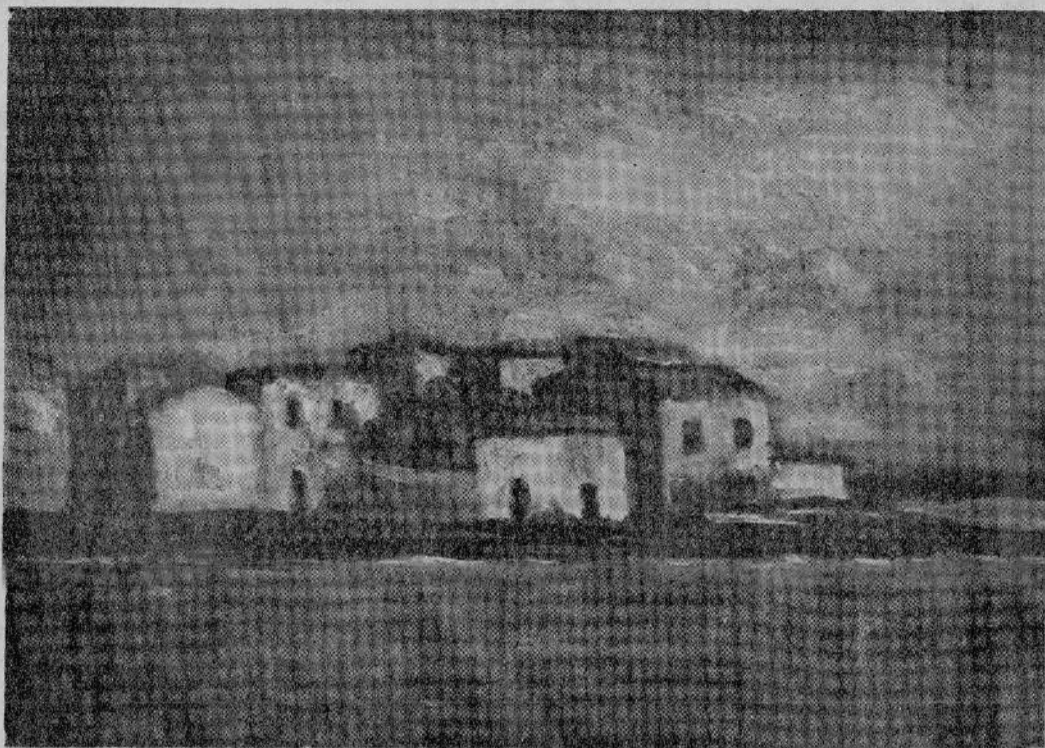
Paesaggio a Marzamemi

IN CRISTINA VI E' UNA SOLIDITA' DI IMPIANTO ED UN ACCENTO MATERICO-TONALE CHE DA' ALLA SUA PITTURA UN VIGORE PLASTICO AL QUALE CARRA' NON POTEVA SFOCIARE, APPUNTO PER DIVERSITA' DI TEMPERAMENTO