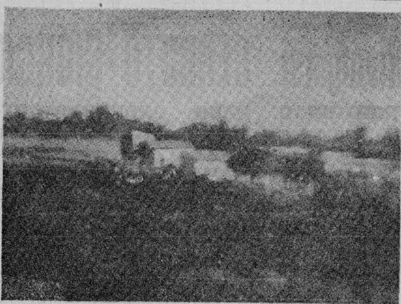
Paesaggio alla Marza (olio su tela)

Il Lucenti attualmente partecipa a Milano ad una collettiva presso la galleria d'arte «Garrone».