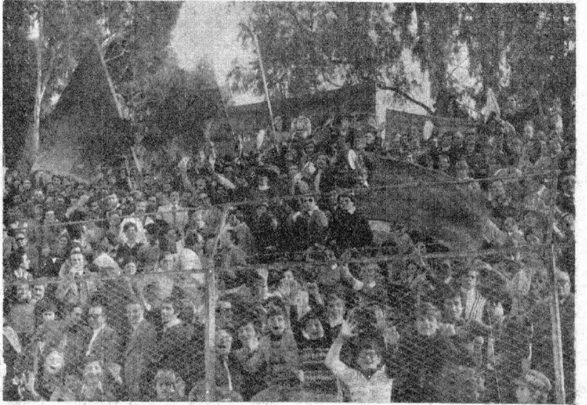
UNO SQUARCIO DI TIFO IN TRIBUNA «A» AL «V. BARONE»

ESPLOSIONE DI TRAVOLGENTE ENTUSIASMO S PINGE I TIGROTTI AD IMPORRE DI PREPOTENZA UNA BRILLANTE VITTORIA