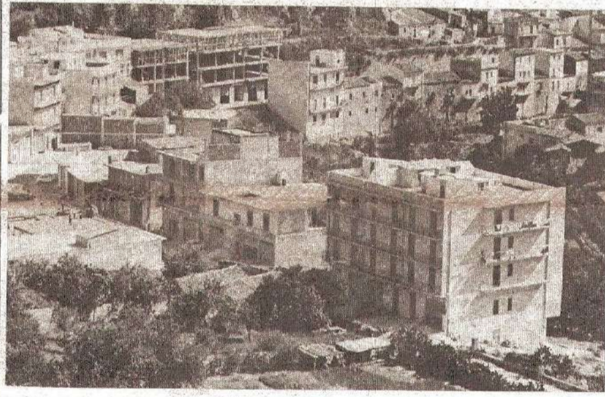
Un aspetto del disordine edilizio a Modica.