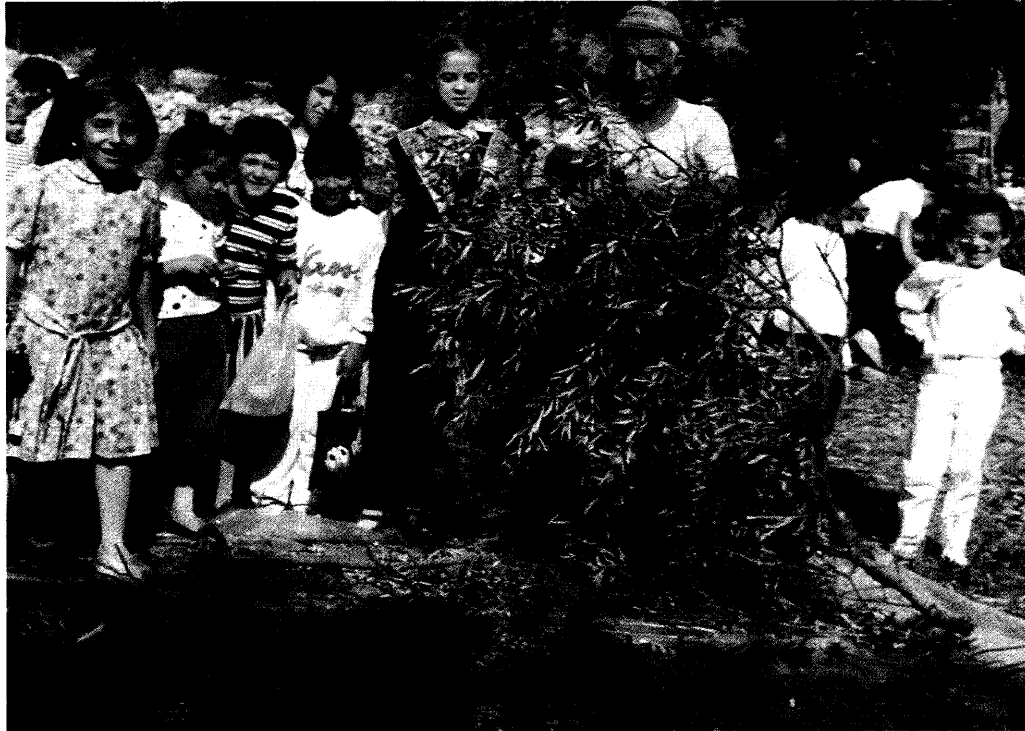
Foto 7 - "... utilità e dannosità della battitura dei rami...". (Pag. 50)

a tutti nota, della nostra realtà passata. Successivamente avremmo cercato parallelismi e diversità con la nostra vita attuale.