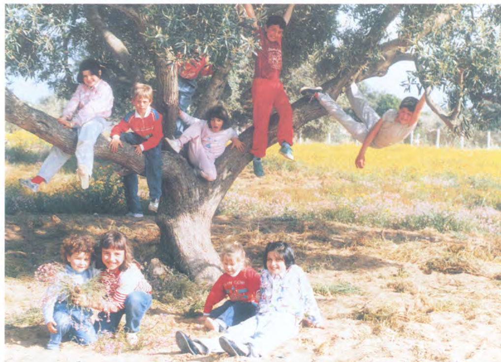
Foto 2 - "... bambini che prendevano d'assalto un grande olivo: grappoli di gambe che si dondolavano fra i rami". (Pag. 56)