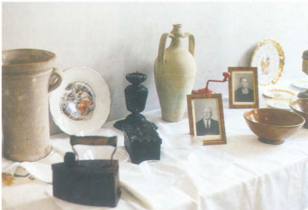
Foto 3 - "E quanti oggetti, rispolverati e tirati a lucido, vennero tratti alla luce da soffitti e cassettoni!". (Pag. 63)