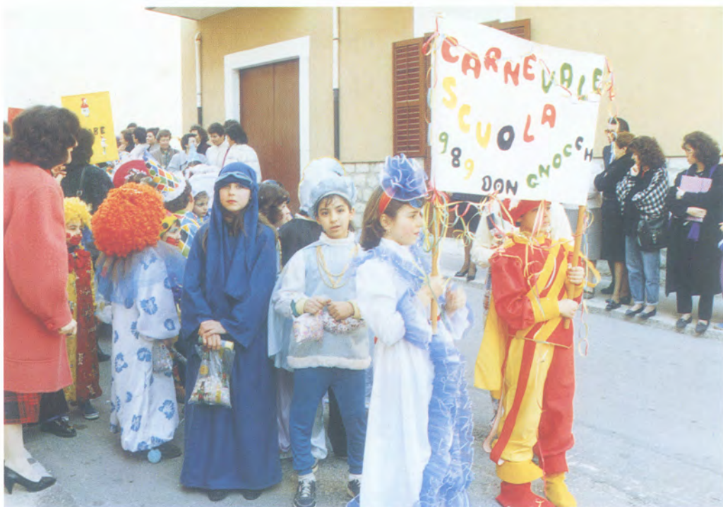
Foto 4 - "... un grandissimo corteo ordinato secondo le tematiche svolte dalla prima alla quinta classe...". (Pag. 89)

tuazione che, cominciata possibilmente sotto forma di gioco innocuo, era andata sempre più aggravandosi, senza che nessuno ne parlasse apertamente?