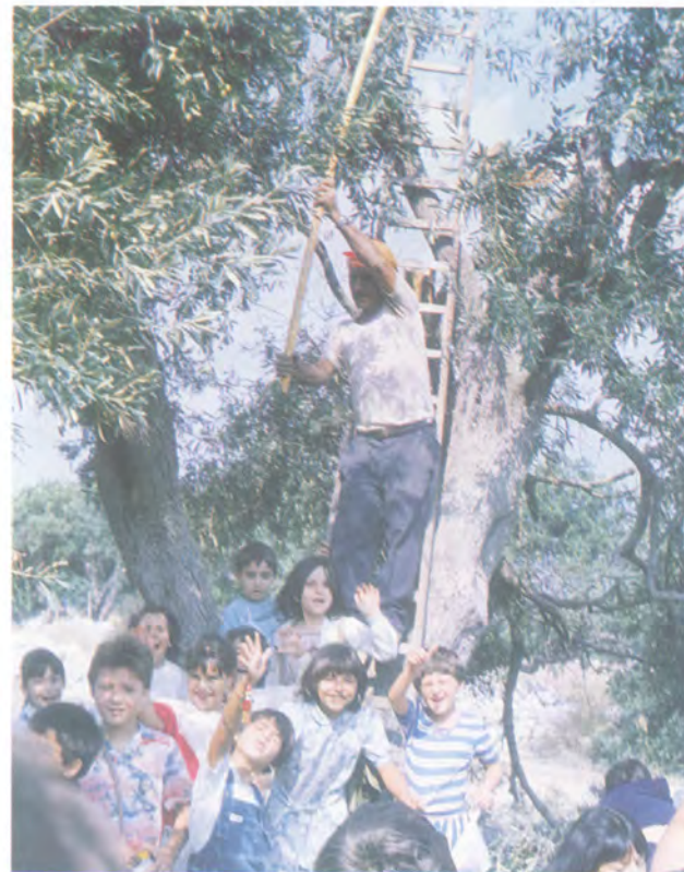
Foto 1 - "... raccolta delle olive che si stava effettuando ..." (Pag. 50)

Come mai si era saputo soltanto allora, dopo mesi, di una si-