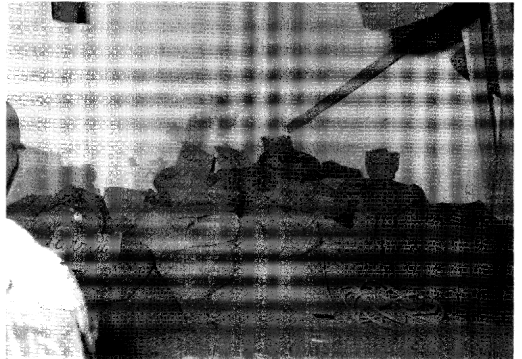
Foto 6 - "Ricostruimmo il 'magazé' accatastando 'sacchi ri lona' ... ... Moltissimi ... semipieni ed aperti, servirono per esporre le tantissime varietà di sementi ...". (Pag. 101)