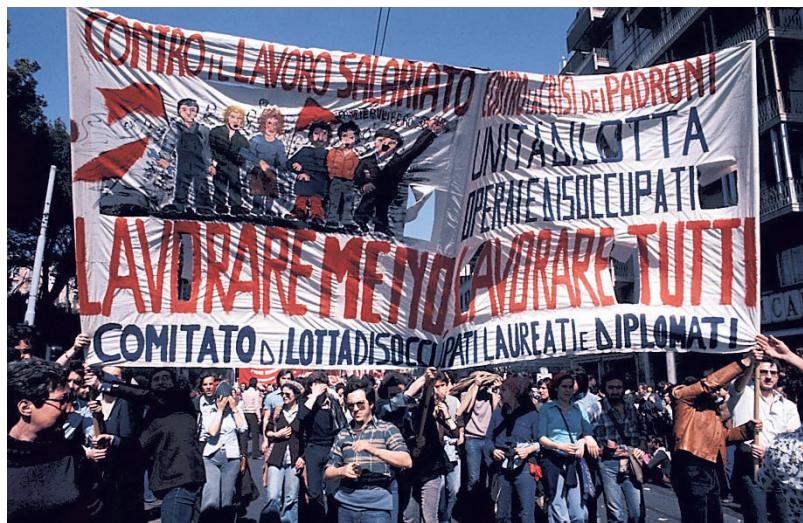
▲ Sciopero Corteo negli 'anni 70'. A lato Charlie Chaplin in Tempi moderni