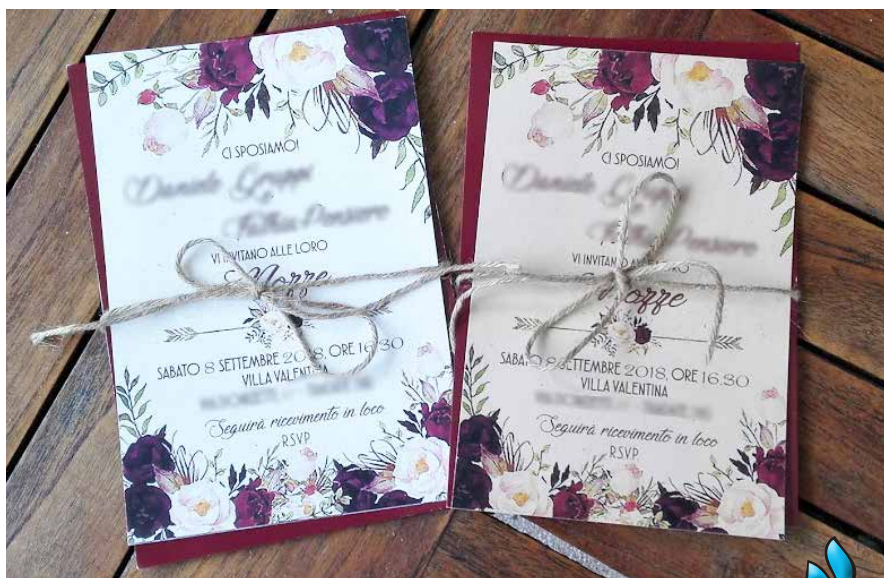
Modello Velvet Roses