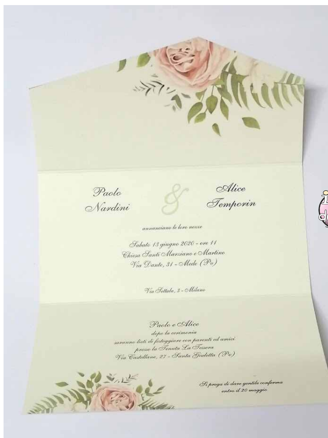
Modello Cotton Candy