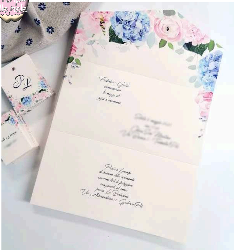
Modello Ortensia blu