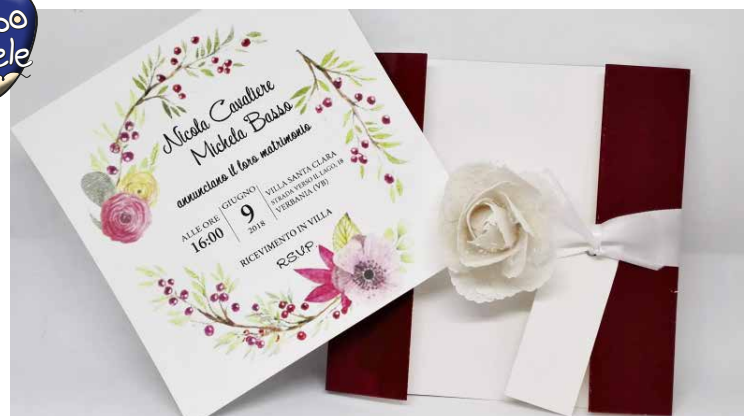
Modello La bacca rossa