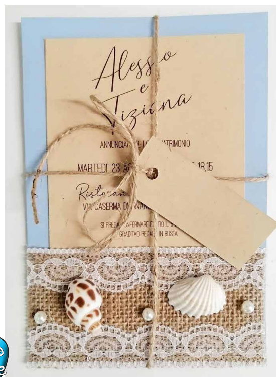
Modello Mare d'amore