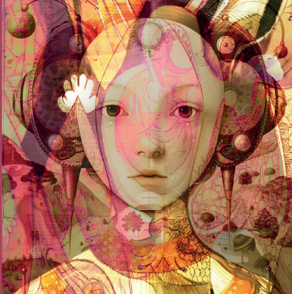
immagine di Simona Bursi