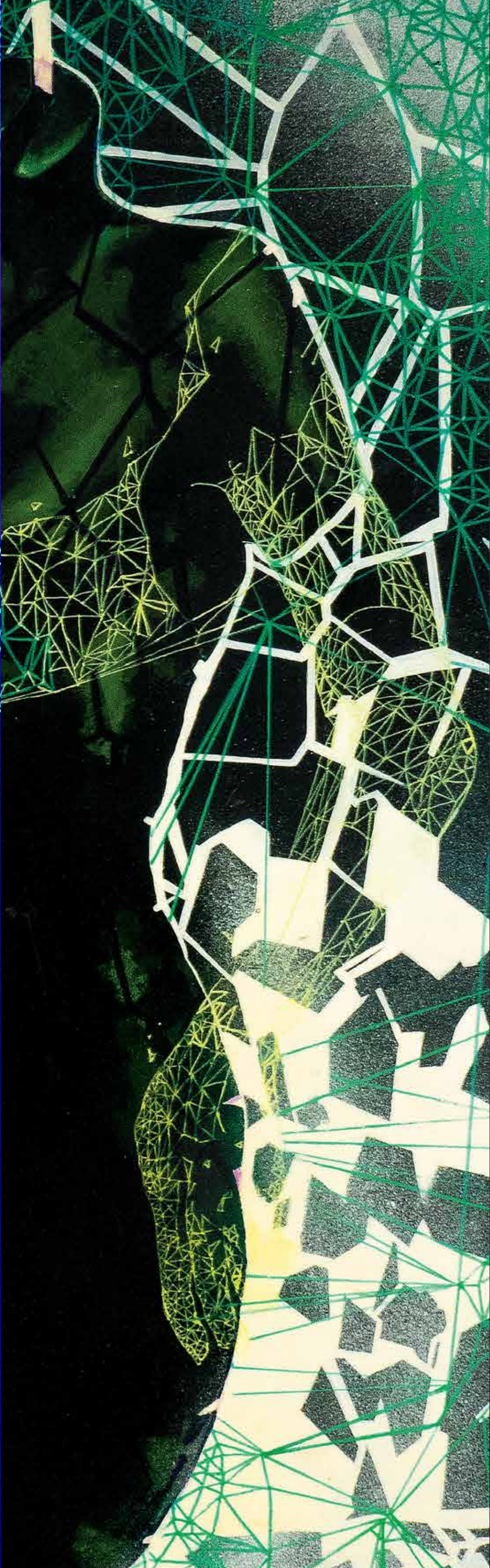
acrilico su legno 100x50 cm