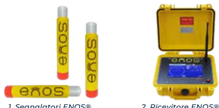
1. Segnalatori ENOS®