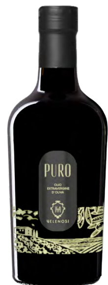
PURO - OLIO EXTRAVERGINE DI OLIVA

Cultivar: Leccino, Tenera Ascolana, Frantoio