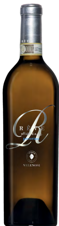
RÊVE - OFFIDA DOCG PECORINO

Varietà Vitigni/Grape variety: Pecorino 100%