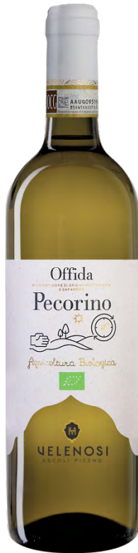
OFFIDA DOCG PECORINO

Varietà Vitigni/Grape variety: Passerina 100%