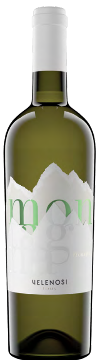
MONTAGNA FALERIO DOC PECORINO

Varietà Vitigni/Grape variety: Pecorino 100%