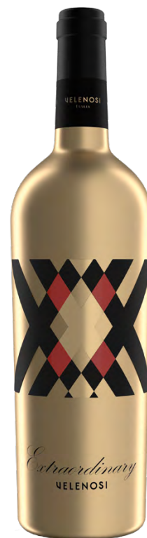
EXTRAORDINARY MARCHE IGT ROSSO

Varietà Vitigni/Grape variety: Montepulciano, Cabernet Sauvignon, Merlot