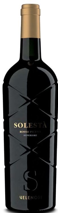
SOLESTÀ ROSSO PICENO DOC SUPERIORE

Varietà Vitigni/Grape variety: Sangiovese, Lacrima, Montepulciano