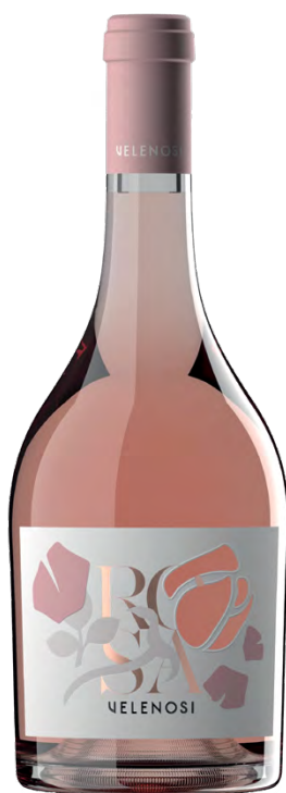
ROSA - MARCHE IGT ROSATO

Varietà Vitigni/Grape variety: Trebbiano, Passerina, Pecorino