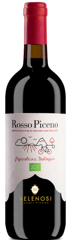
ROSSO PICENO DOC

Varietà Vitigni/Grape variety: Pecorino 100%