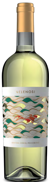
OFFIDA DOCG PECORINO

Varietà Vitigni/Grape variety: Pecorino 100%