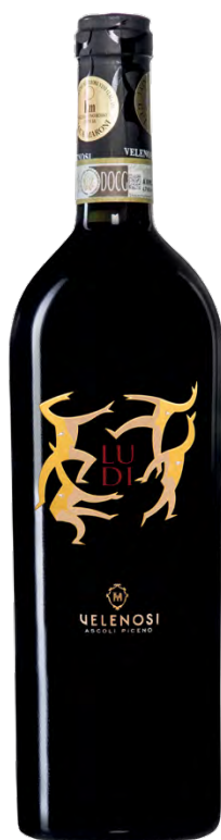
LUDI - OFFIDA DOCG ROSSO

Varietà Vitigni/Grape variety: Montepulciano, Sangiovese