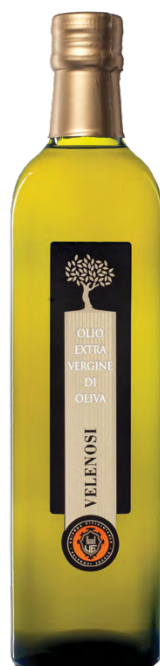
OLIO EXTRAVERGINE DI OLIVA

Cultivar: Leccino, Tenera Ascolana, Frantoio