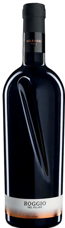
ROGGIO DEL FILARE ROSSO PICENO DOC SUPERIORE

Varietà Vitigni/Grape variety: Montepulciano, Sangiovese