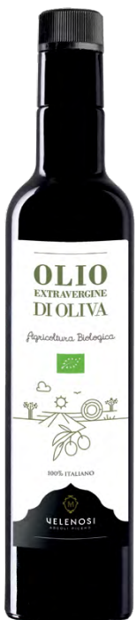
OLIO EXTRAVERGINE DI OLIVA BIO

Cultivar: Leccino, Tenera Ascolana, Frantoio