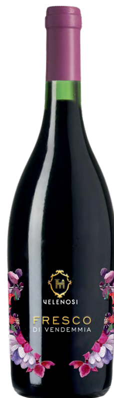
FRESCO DI VENDEMMIA MARCHE IGT ROSSO NOVELLO

Varietà Vitigni/Grape variety: Montepulciano, Sangiovese