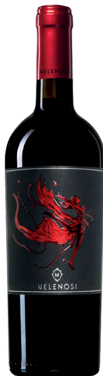
NINFA - VINO ROSSO

Varietà Vitigni/Grape variety: Montepulciano, Sangiovese