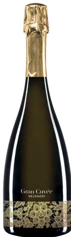
GRAN CUVÉE GOLD

Varietà Vitigni/Grape variety: Chardonnay, Pinot Nero Metodo Classico