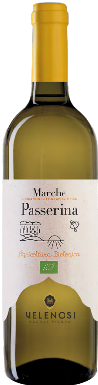
MARCHE IGT PASSERINA

Varietà Vitigni/Grape variety: Passerina 100%