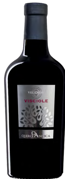
VINO E VISCIOLE SELEZIONE

Varietà Vitigni/Grape variety: Lacrima, Sciroppo di Visciole Residuo zuccherino: g/l 160