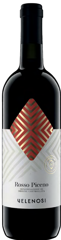
ROSSO PICENO DOC

Varietà Vitigni/Grape variety: Lacrima, Sciroppo di Visciole Residuo zuccherino: g/l 160