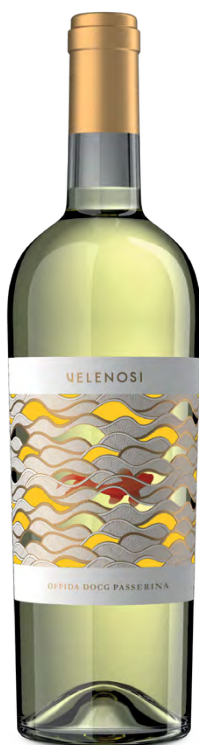
OFFIDA DOCG PASSERINA

Varietà Vitigni/Grape variety: Pecorino 100%