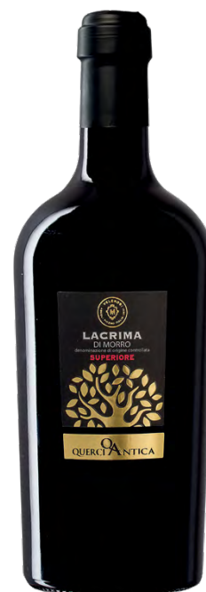
LACRIMA DI MORRO DOC SUPERIORE

Varietà Vitigni/Grape variety: Montepulciano, Cabernet Sauvignon, Merlot, Syrah