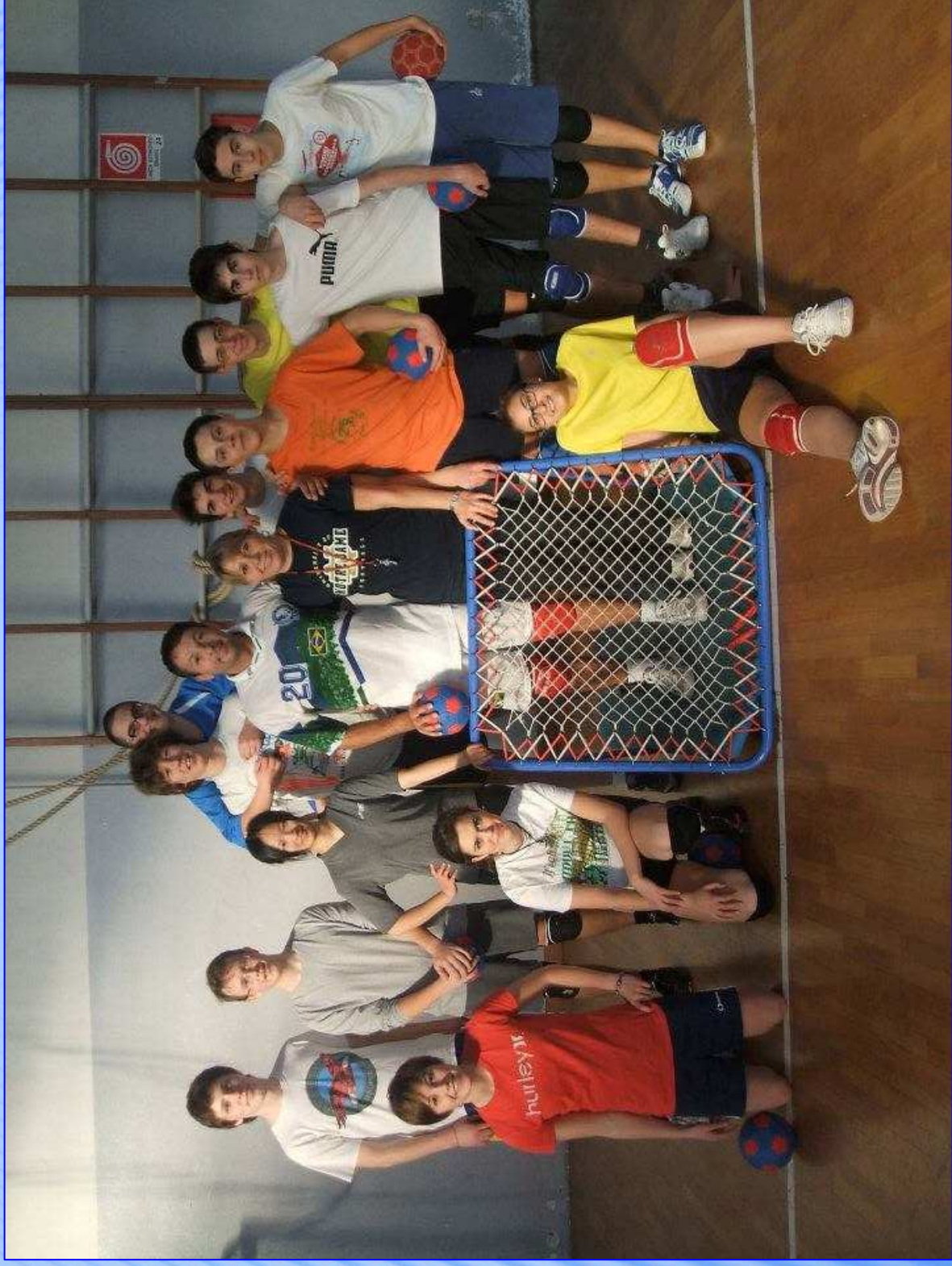
ARTISTICA-MENTE - Tradate - 18 febbraio 2017