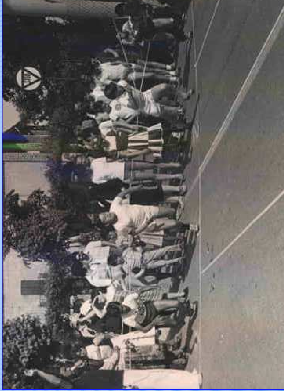
ARTISTICA-MENTE - Tradate - 18 febbraio 2017