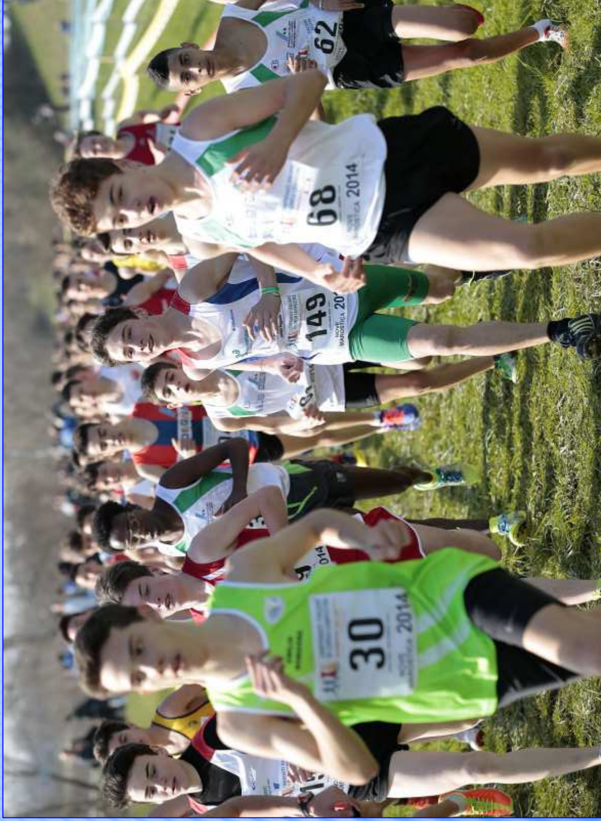
ARTISTICA-MENTE - Tradate – 18 febbraio 2017