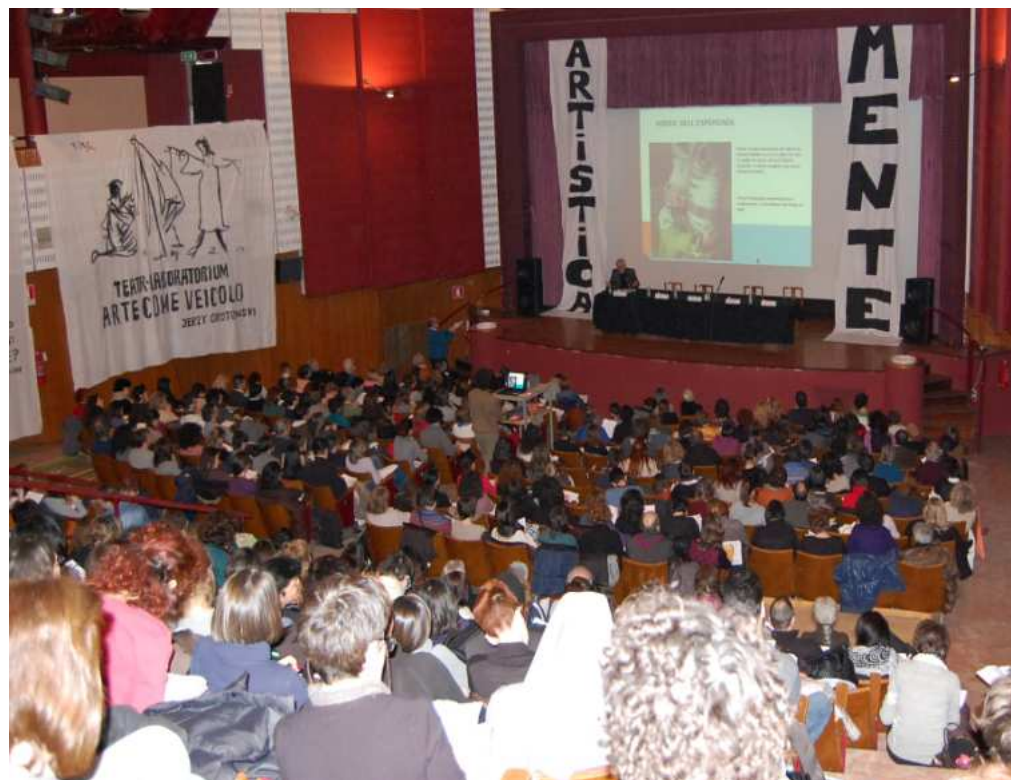
Progetto "ArtisticaMente": Convegni e laboratori nazionali e internazionali sull'Educazione alla Teatralità e sulle arti espressive.