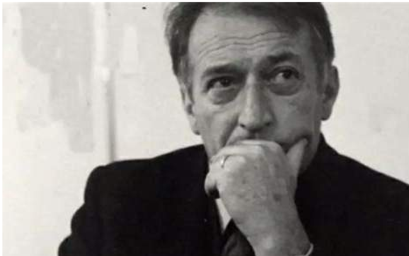
Gianni Rodari https://giannirodari.org

Una via utile per contribuire a costruire un processo di educazione alla pace può essere il recupero del buon uso della parola, una parola di qualità a cui possiamo attingere quando ci avviciniamo ai testi letterari sia come lettori sia come potenziali scrittori inseriti in laboratori di scrittura creativa. Gli artisti della parola, ovvero gli autori di testi letterari, ci insegnano che per dire con precisione quanto abbiamo in mente è necessario scegliere la parola giusta, cercandola tra quelle che conosciamo oppure mettendosi sulle tracce di parole nuove che possiamo inserire nel nostro lessico attraverso la lettura di testi scritti da altri. Leggere quindi ha un grande valore formativo perché offre la possibilità di un