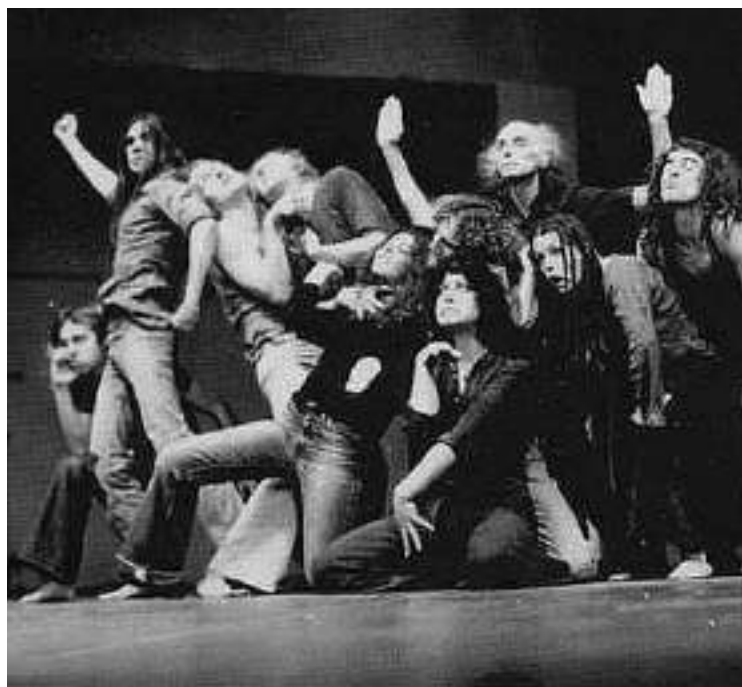
Il Living Theatre nello spettacolo "Antigone" https://www.livingeuropa.eu/