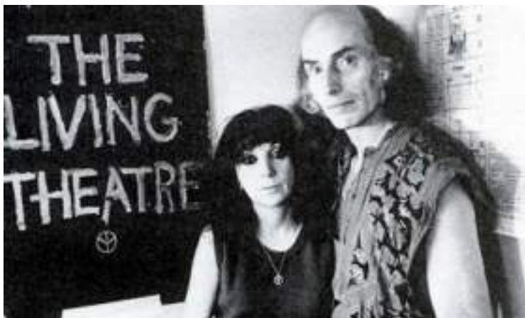
Julian Beck e Judith Malina https://www.livingeuropa.eu/

Il regista tedesco parlava di Teatro come azione politica in cui lo spettacolo aveva l'obiettivo di attivare il pubblico e renderlo consapevole. Il Living Theatre sposa questa visione teatrale e sperimenta i suoi spettacoli diversi modi per sollecitare il pubblico, spingendolo a entrare e a partecipare alle performance, per provocarlo, per porlo in una situazione di incertezza; mostra allo spettatore la crudezza e crudeltà della vita per rivitalizzarlo affinché, finito lo spettacolo, sia spinto ad agire per cambiare il mondo. Il teatro ha a che fare con la vita e, come la vita, va preso sul serio: è questa la lezione di Artaud che il collettivo newyorchese fa propria cercando un teatro della crudeltà, che mostri la realtà così com'è nella sua crudezza, che scuota e tocchi profondamente gli spettatori e li porti a loro volta a reagire al sistema e a far esplodere la rivoluzione.