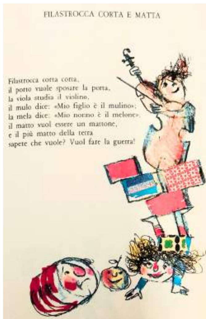
Immagine tratta dal libro Rodari. Le parole animate , editore Interlinea, 1993

In questo breve componimento accanto ai "bisticci lessicali" e ai giochi di parole, tipici della scrittura rodariana, che possono far sorridere, c'è il binomio in rima "terra-guerra" che rimanda il chiaro giudizio dello scrittore che considera il voler fare la guerra un'azione folle, con conseguenze tutt'altro che comiche .