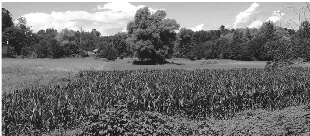
Foto e progetto grafico del manifesto del Festival di Paola D'Alessandro