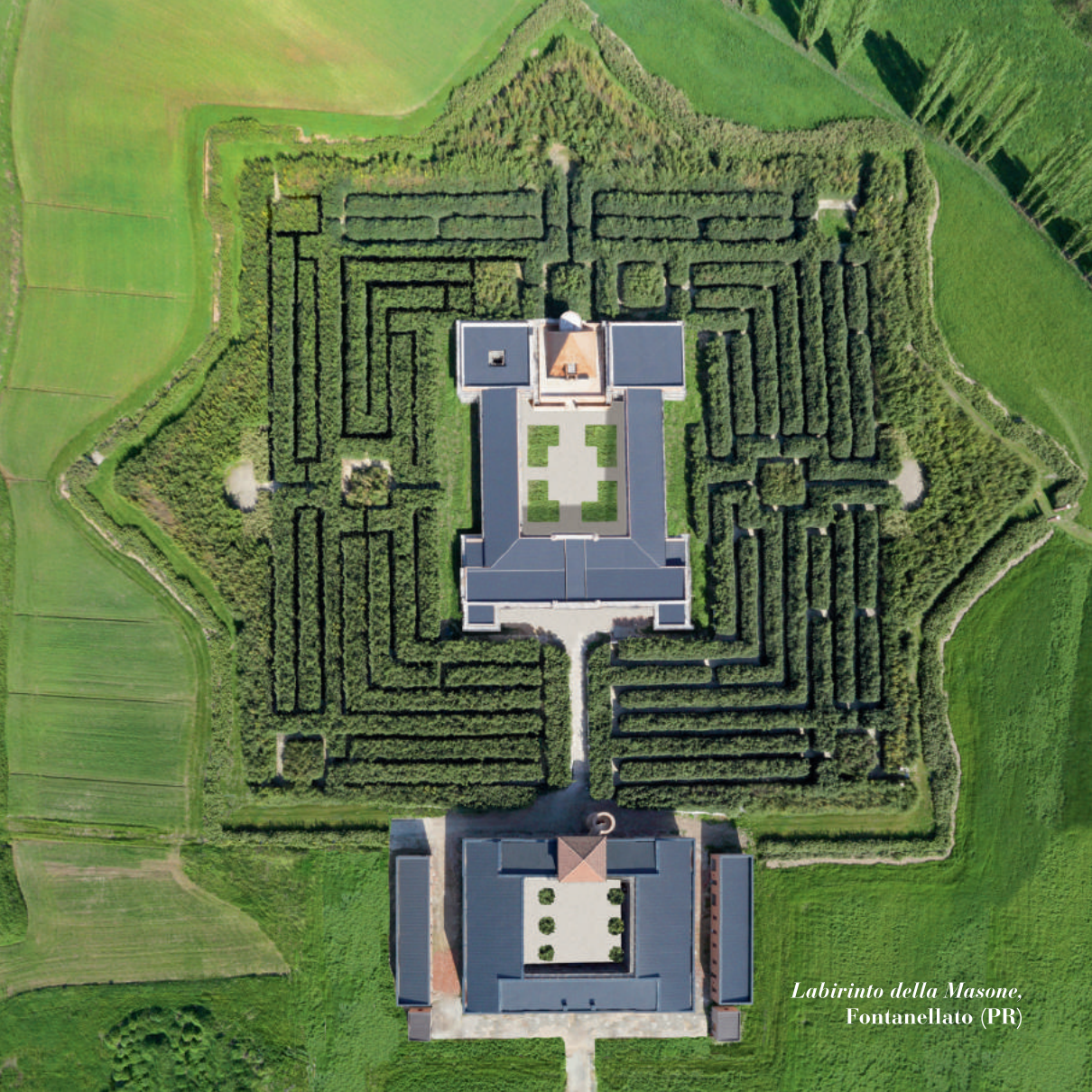
Labirinto della Masone, Fontanellato (PR)