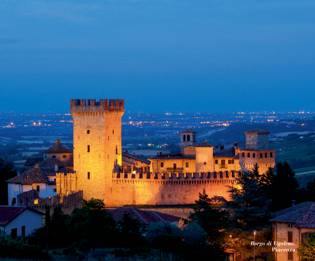
Borgo di Vigoleno, Piacenza