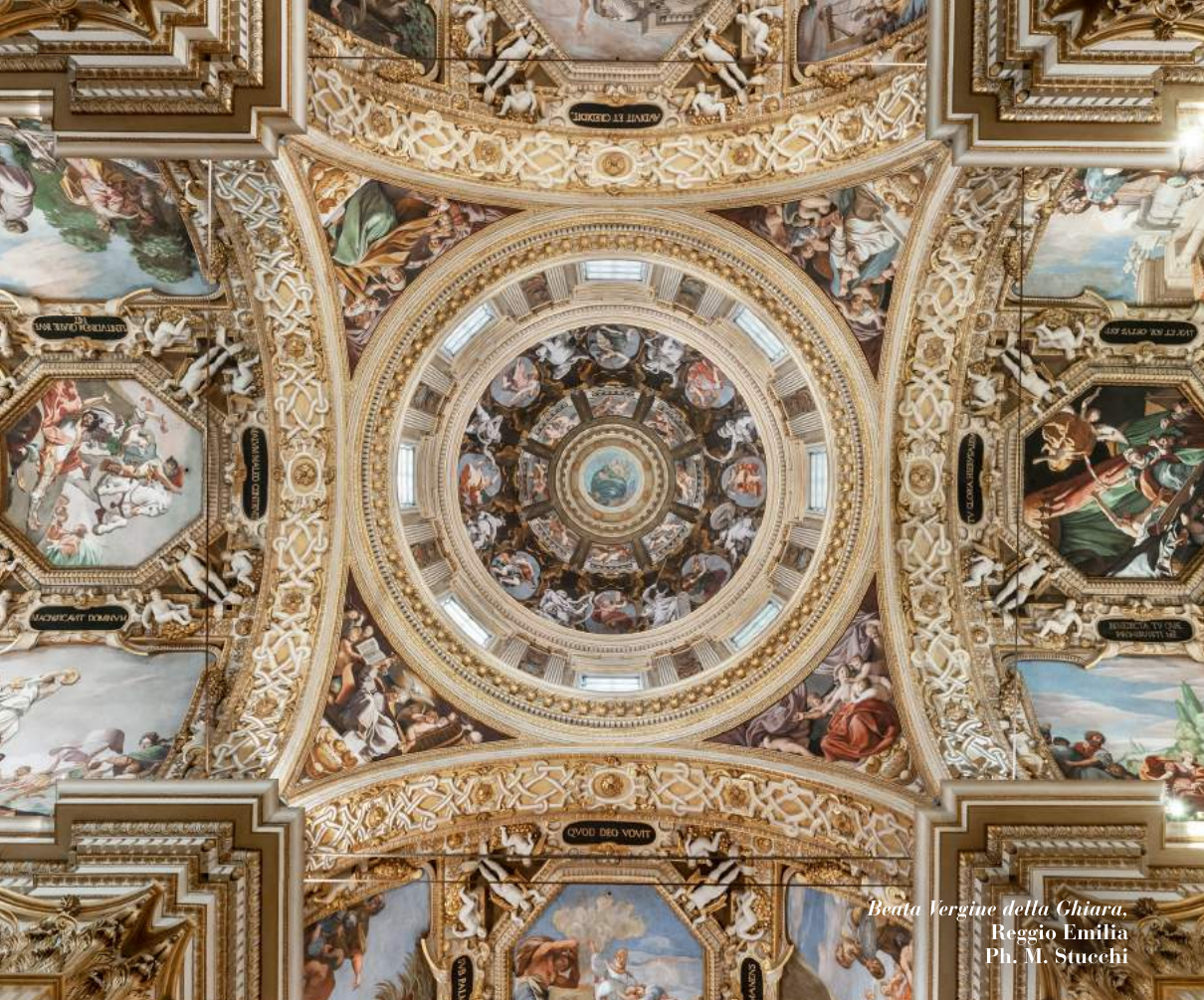
Beata Vergine della Ghiara, Reggio Emilia