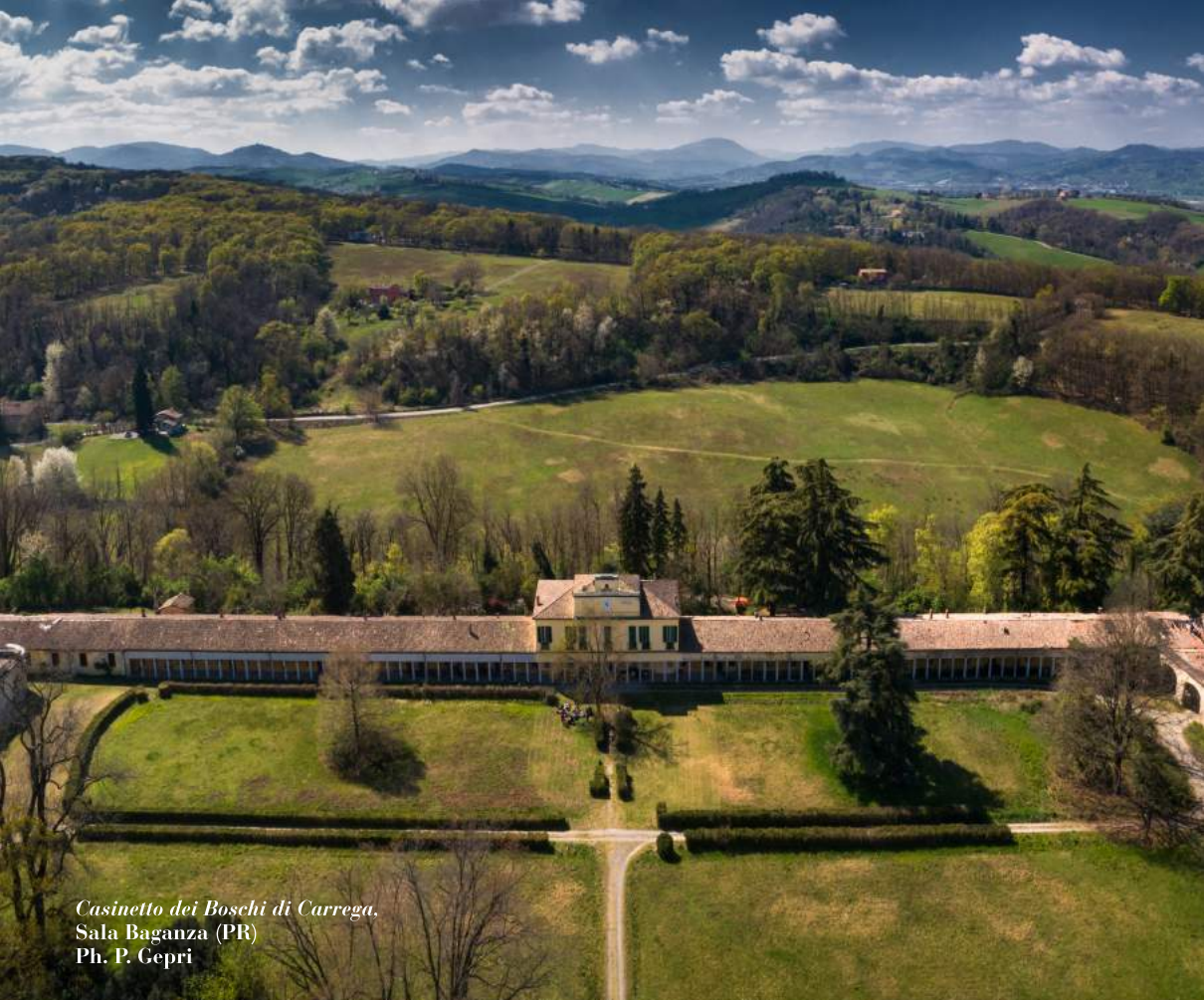
Casinetto dei Boschi di Carrega. Sala Baganza (PR)