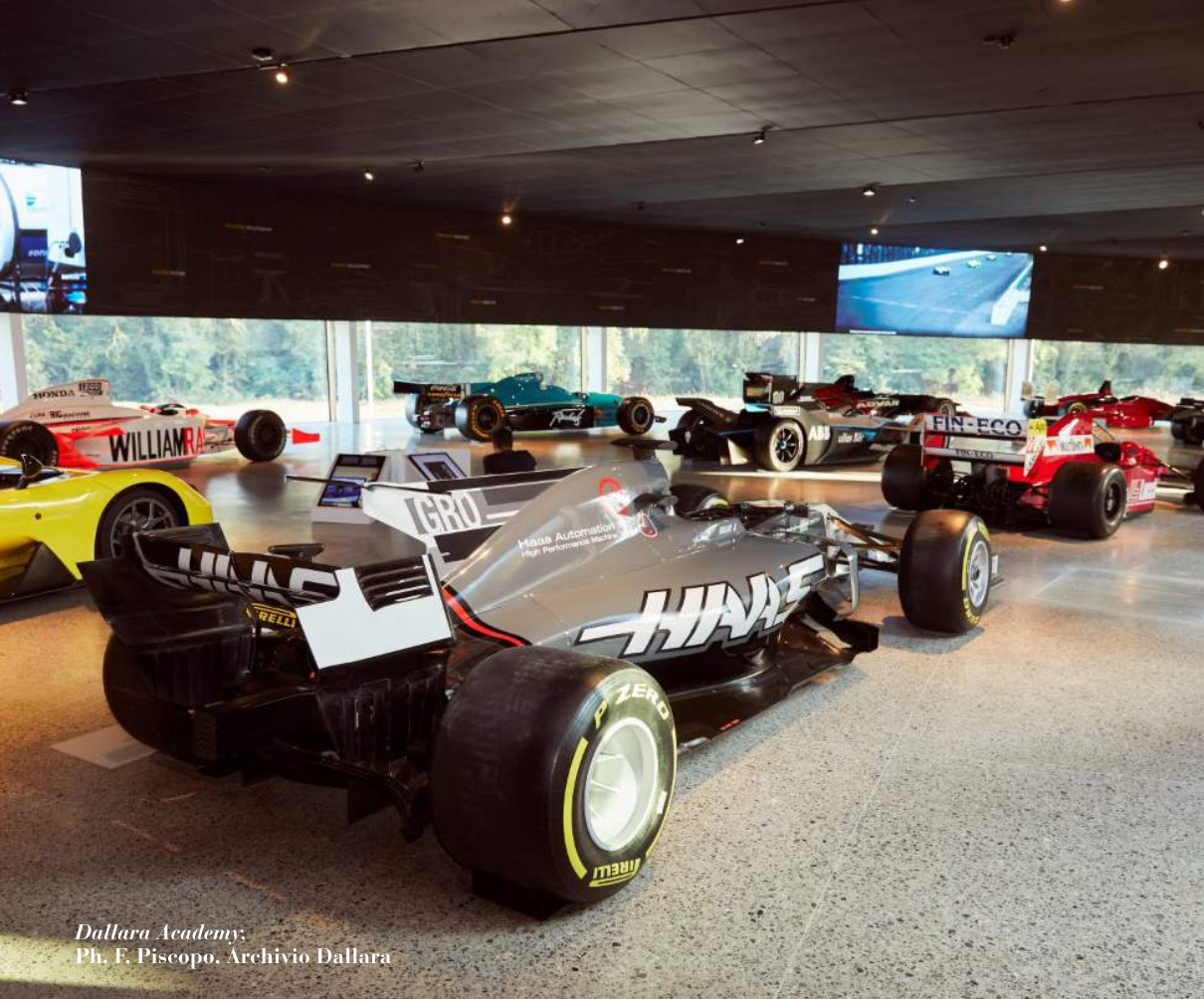
Dallara Academy