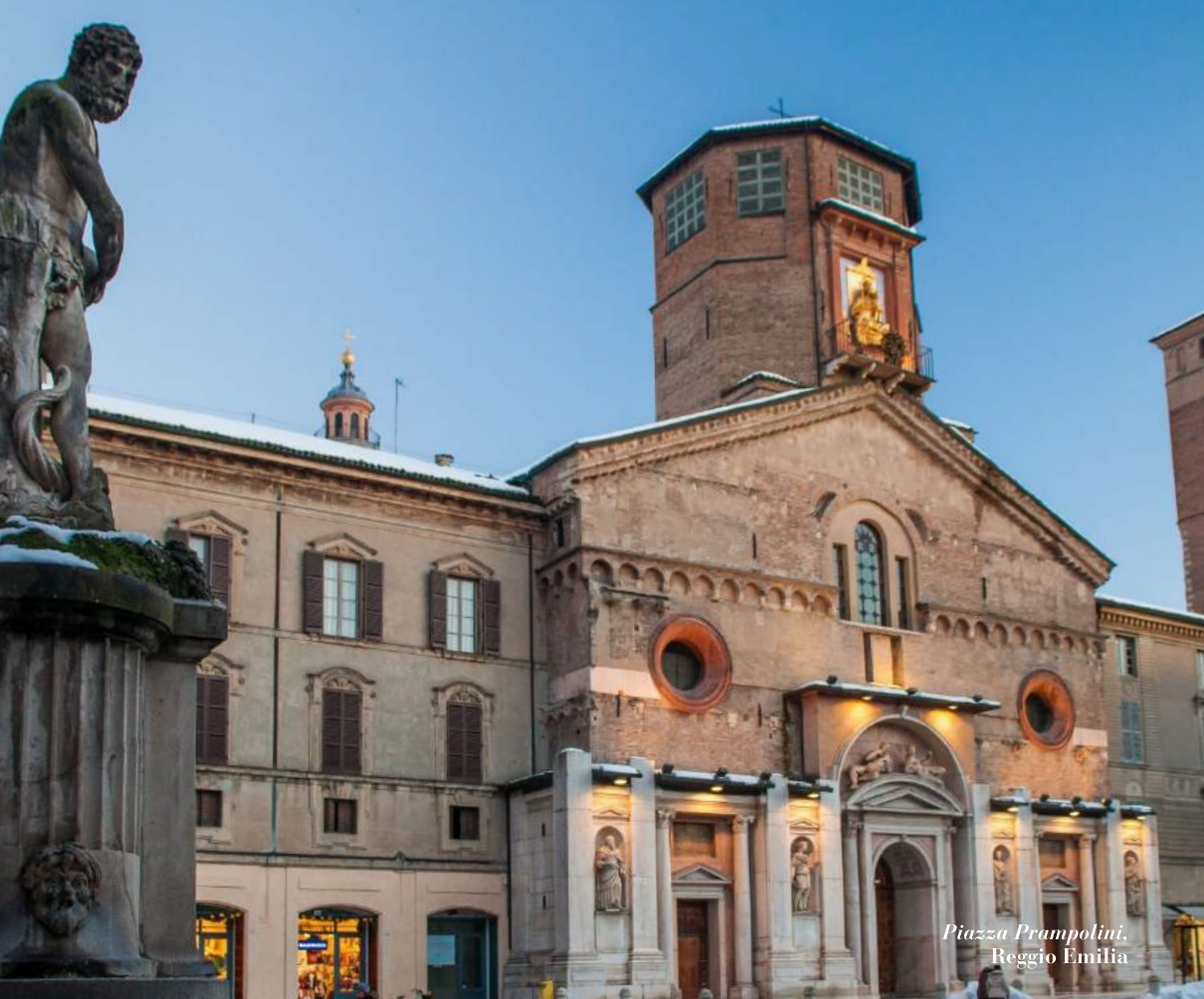
Piazza Prampolini, Reggio Emilia

I Per passeggiare, meravigliandosi, davanti a gioielli incastonati nelle città d'arte d'Emilia: Parma, Piacenza e Reggio Emilia.