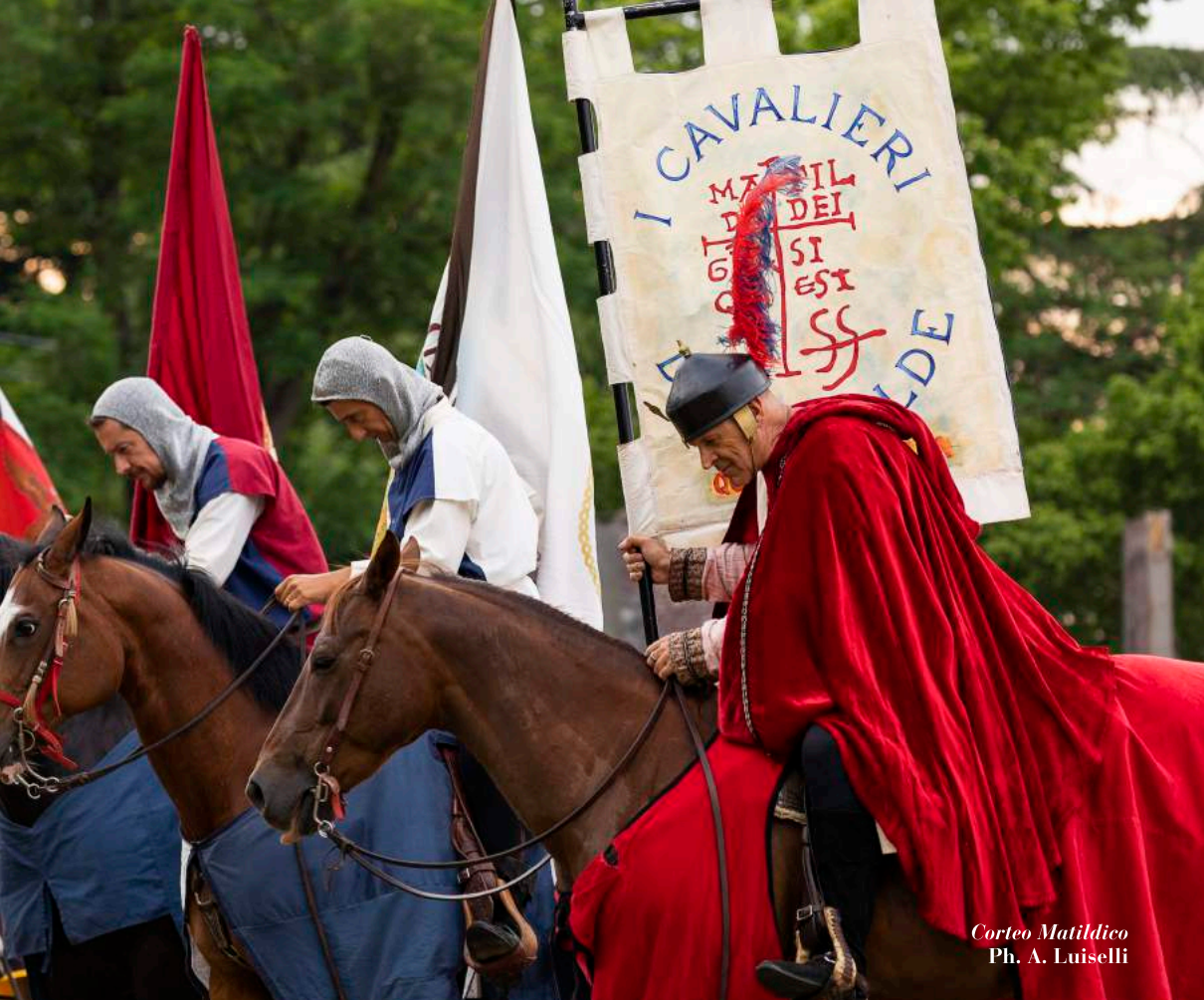
Corteo Matildico