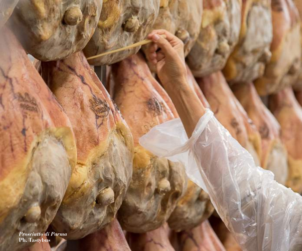
Prosciutto di Parma