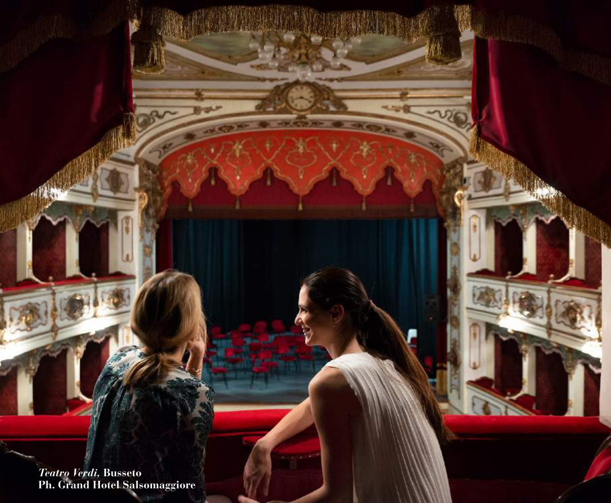
Teatro Verdi, Busseto