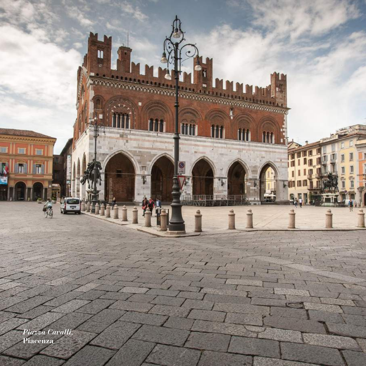
Piazza Cavalli, Piacenza