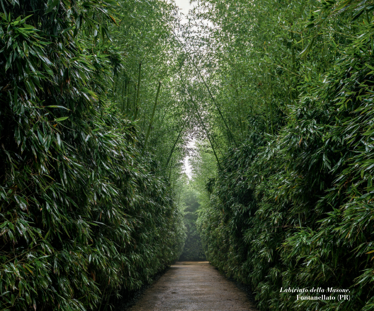
Labirinto della Masone, Fontanellato (PR)