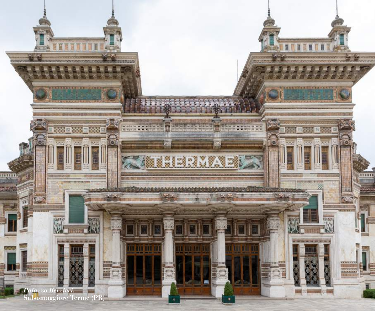
Palazzo Berzteri. Salsomaggiore Terme (PR)