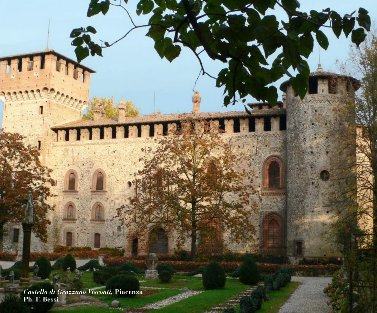
Castello di Grazzano Visconti, Piacenza