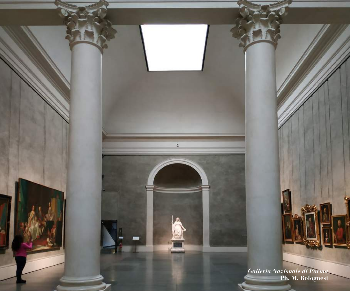
Galleria Nazionale di Parma