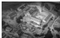
Abbadia Isola, ricostruzione, da AD1213

Intermezzi di musica e canti a tema storico e medievale