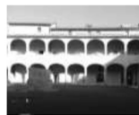
Abbadia Isola, chiostro restauro 2023