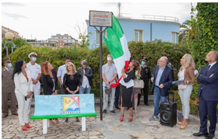
Inaugurazione Panchina Inclusiva di Tutte le Vittime