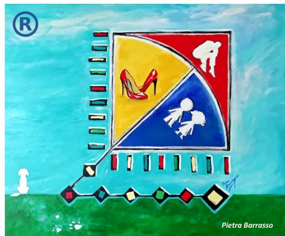
Il disegno Inclusivo di tutte le Vittime: Donne, Uomini, Minori (Animali e Ambiente)