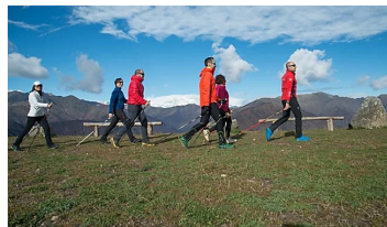
Dal tennis all'enduro, "Weekend a tutto sport!" all'Oasi Zegna