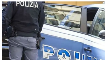
Rubano scarpe e si danno alla fuga in auto, scattano le manette a suocera...