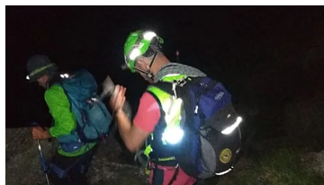
Dal Nord Ovest - Si riparano in baita, escursionisti trovati dal Soccorso...

Ce n'è per tutti i gusti, dallo yoga all'enduro, dal tennis alle bocce. Il "Weekend a tutto..."