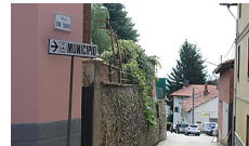
Europrogettazione, a Torrazzo il corso...