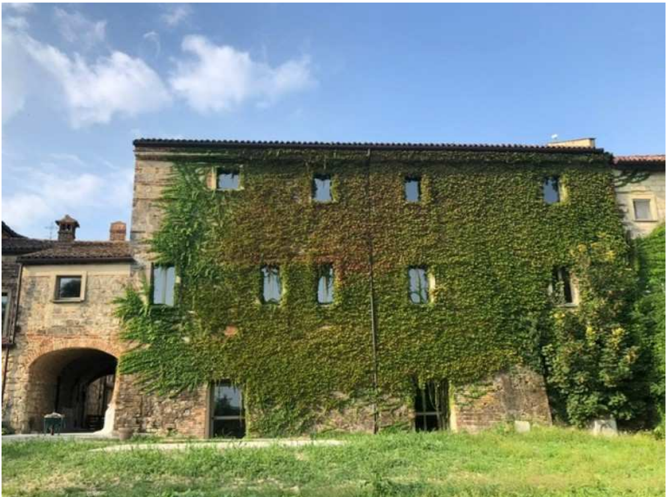
La sede della Fondazione dell'Ecomuseo Pietra da Cantoni

Un nuovo appuntamento con il corso di formazione