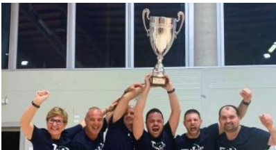
DI VINCENZO LERRO – 17 GIUGNO 2022

Pollone ospita la riunione annuale del CancerPrev, progetto europeo sulla prevenzione dei tumori di cui fa parte la Fondazione Tempia