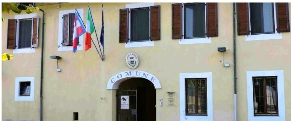
Il Municipio di Borriana

SEI IN: Home » Paesi » Borriana. Volontariato e solidarietà come espressione di cittadinanza attiva: parte il progetto di gemellaggio europeo