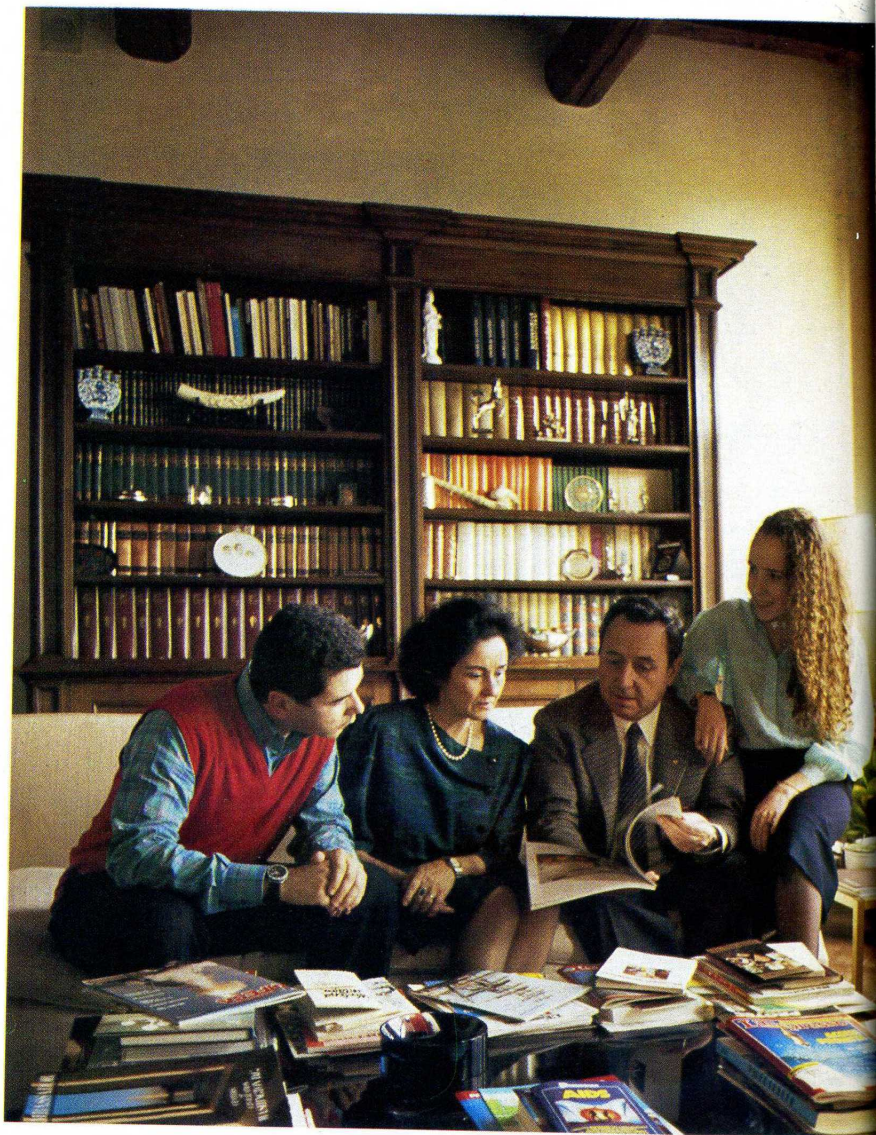
Nei rari momenti di riposo Samoggia ama intrattenersi coi figli e con la moglie parlando di libri.

- Il nome è beneaugurante, botticelliano. Un'iniezione di speranza. Ma non abbiamo sa-