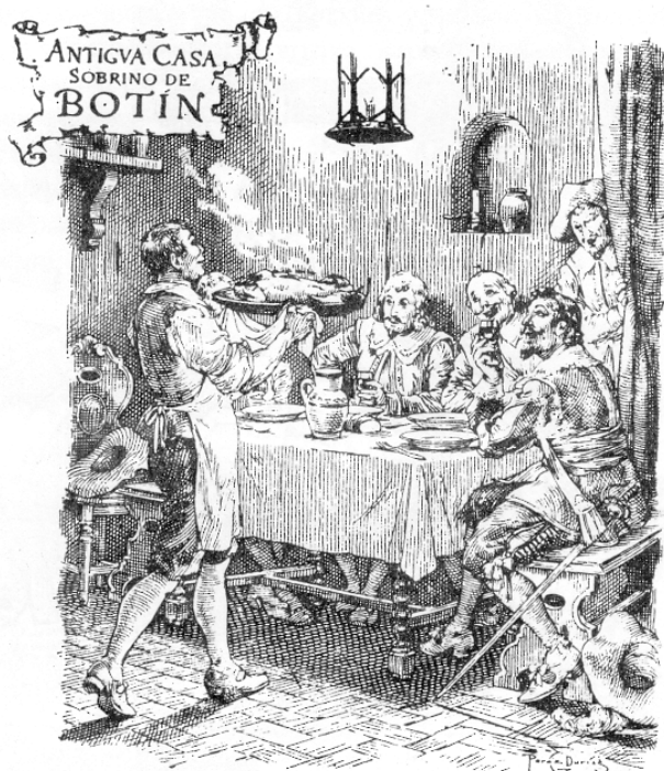
CASA FUNDADA EN 1725 CALLE DE CUCHILLEROS, 17 - MADRID TELEFONO 2 66 42 17

Quando rientriamo c'è una certa confusione in albergo. Si è sparsa la notizia che l'albergo è pieno di italiani e la hall si è riempita di ragazze di tutti i tipi.