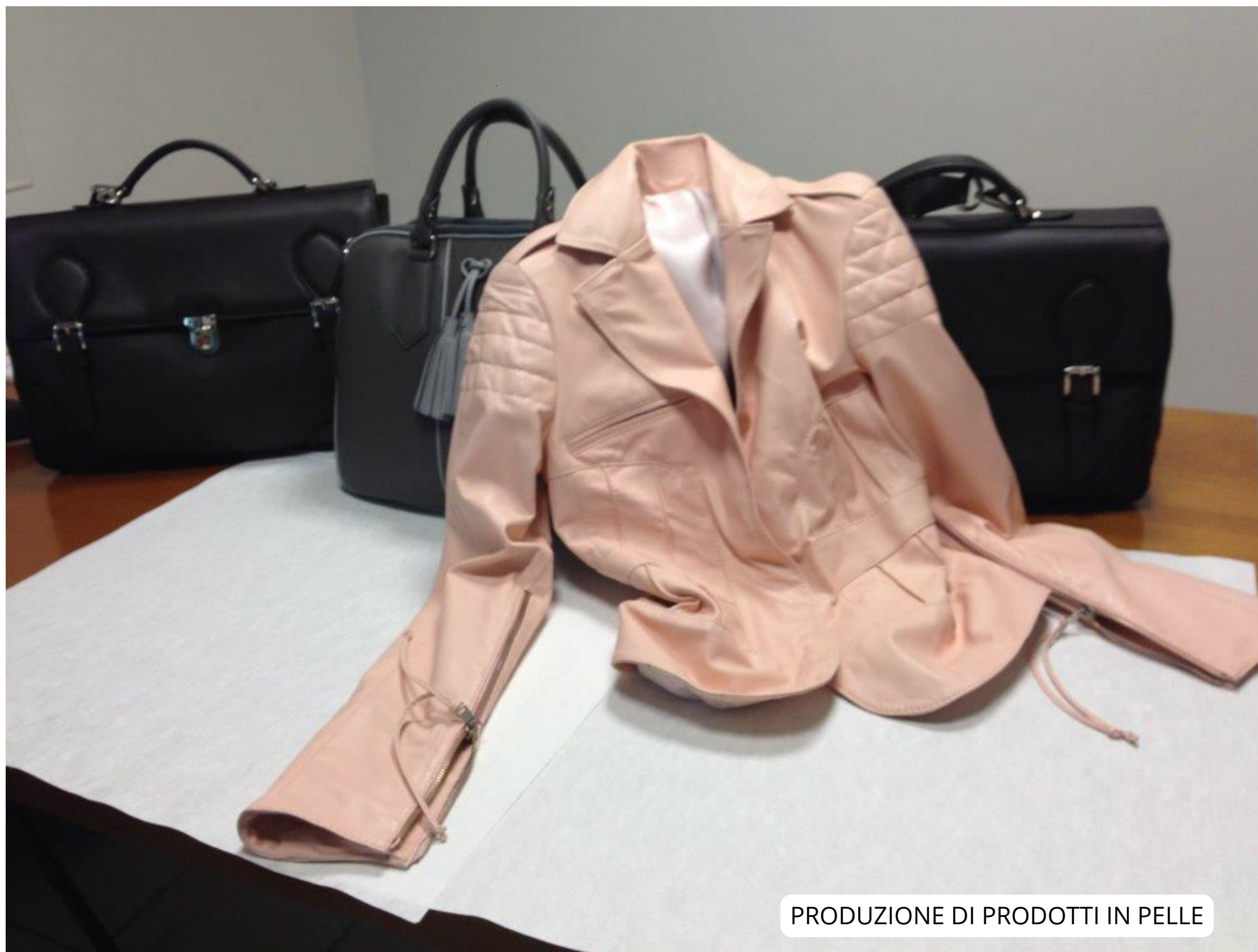
PRODUZIONE DI PRODOTTI IN PELLE