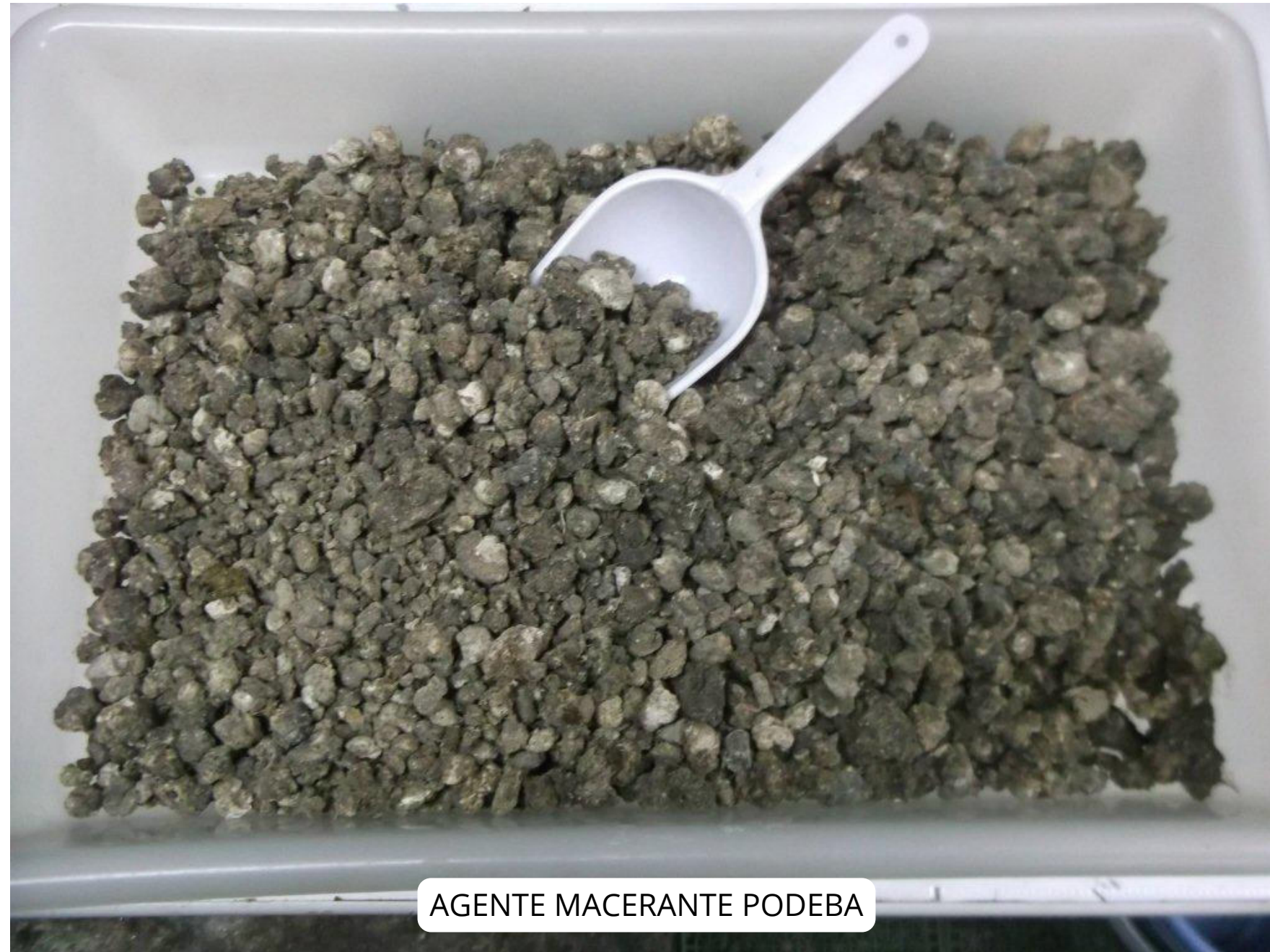
AGENTE MACERANTE PODEBA