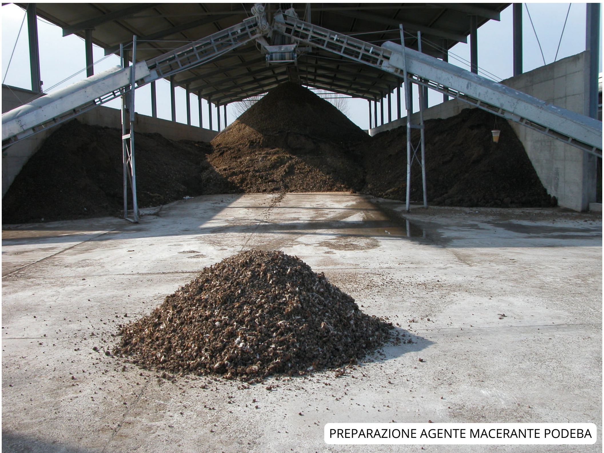
PREPARAZIONE AGENTE MACERANTE PODEBA