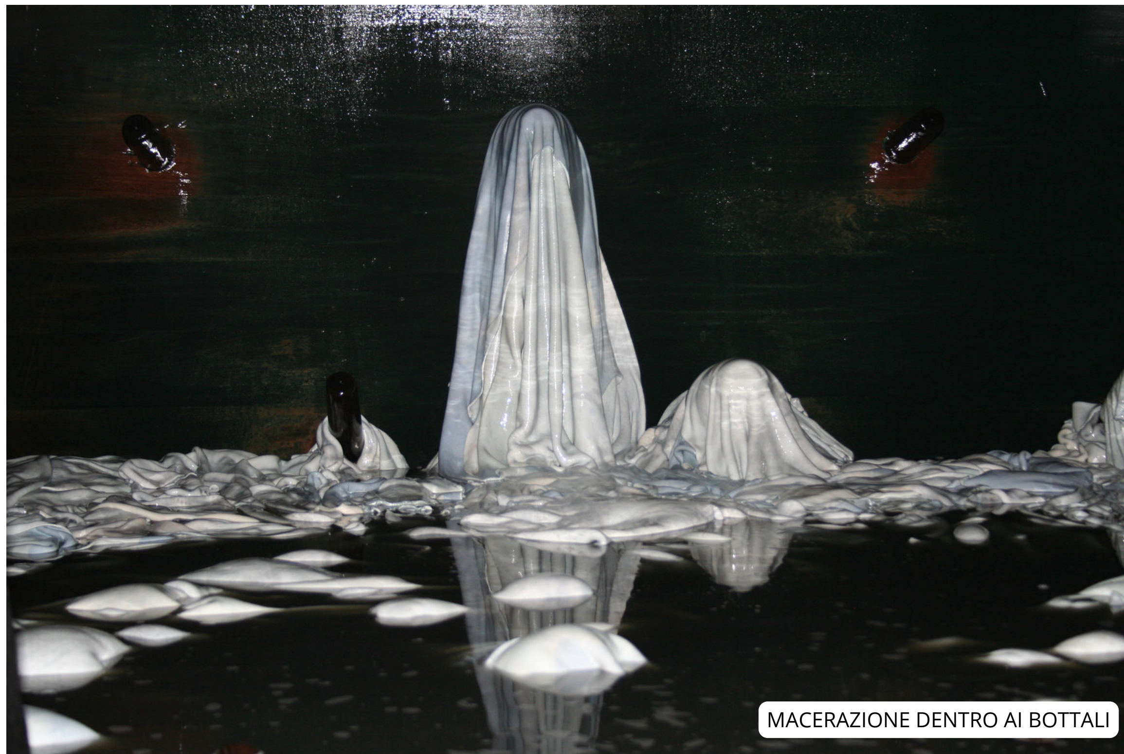
MACERAZIONE DENTRO AI BOTTALI