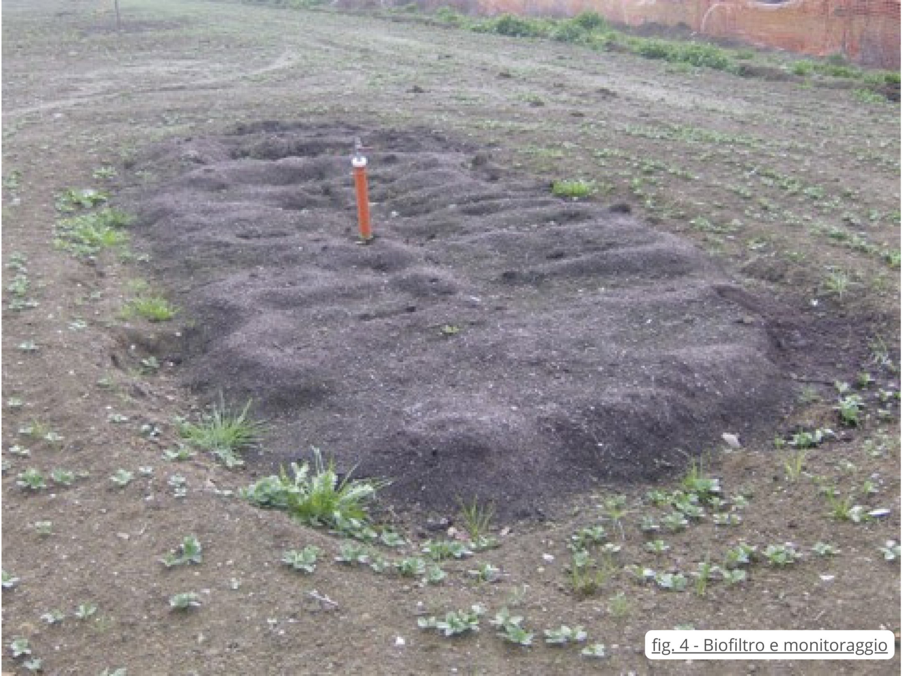
fig. 4 - Biofiltro e monitoraggio