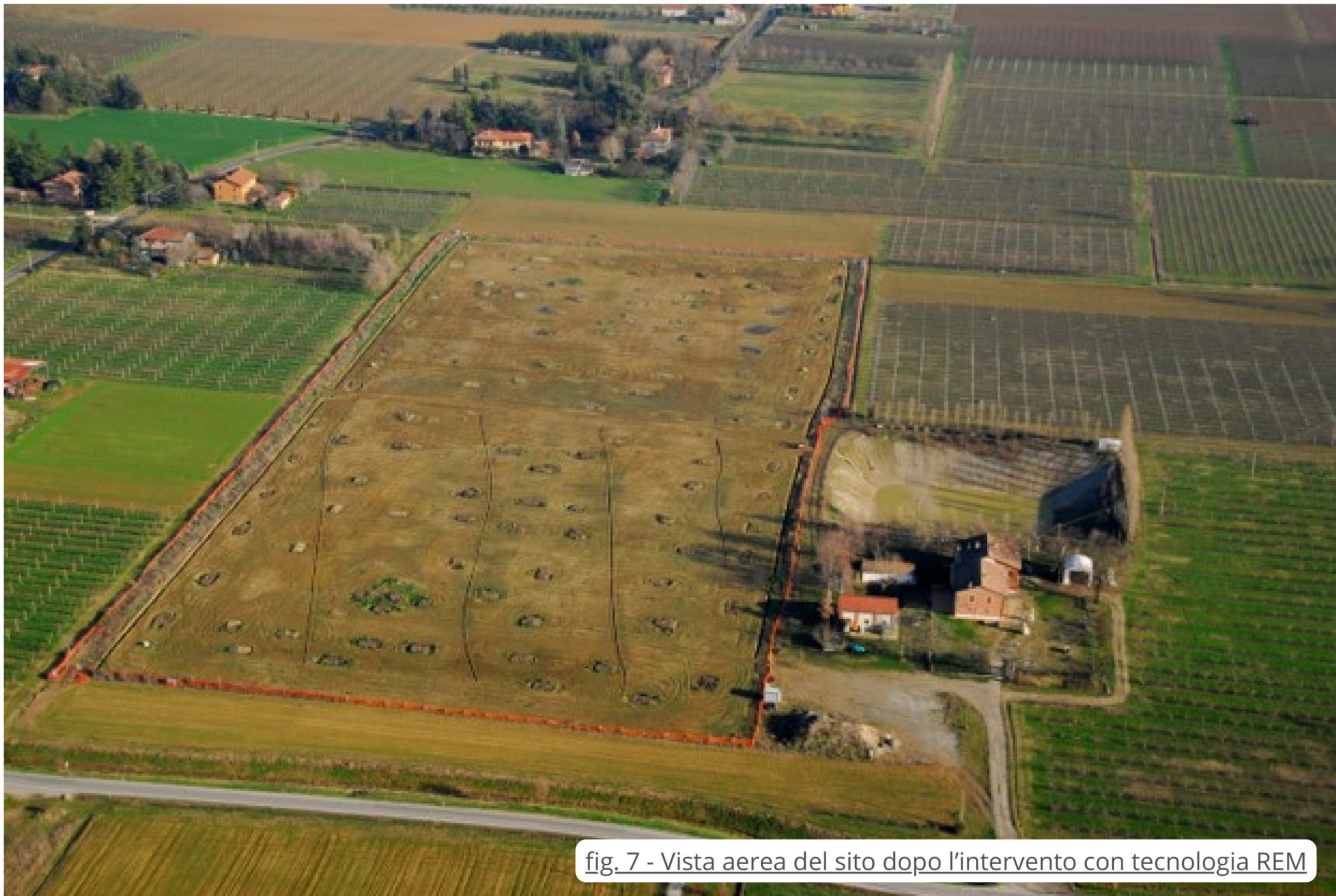
fig. 7 - Vista aerea del sito dopo l'intervento con tecnologia REM