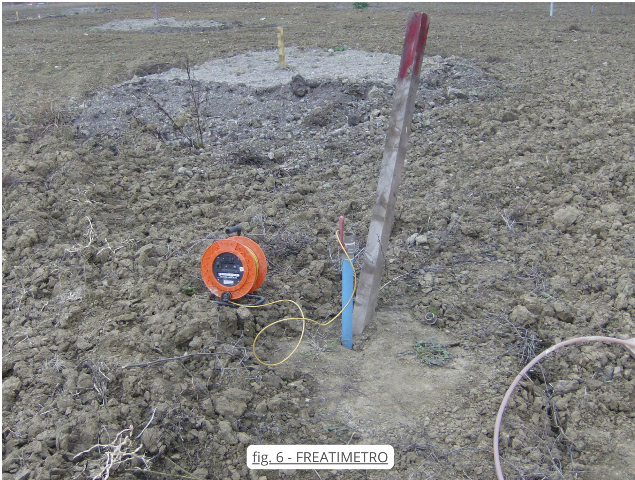
fig. 6 - FREATIMETRO