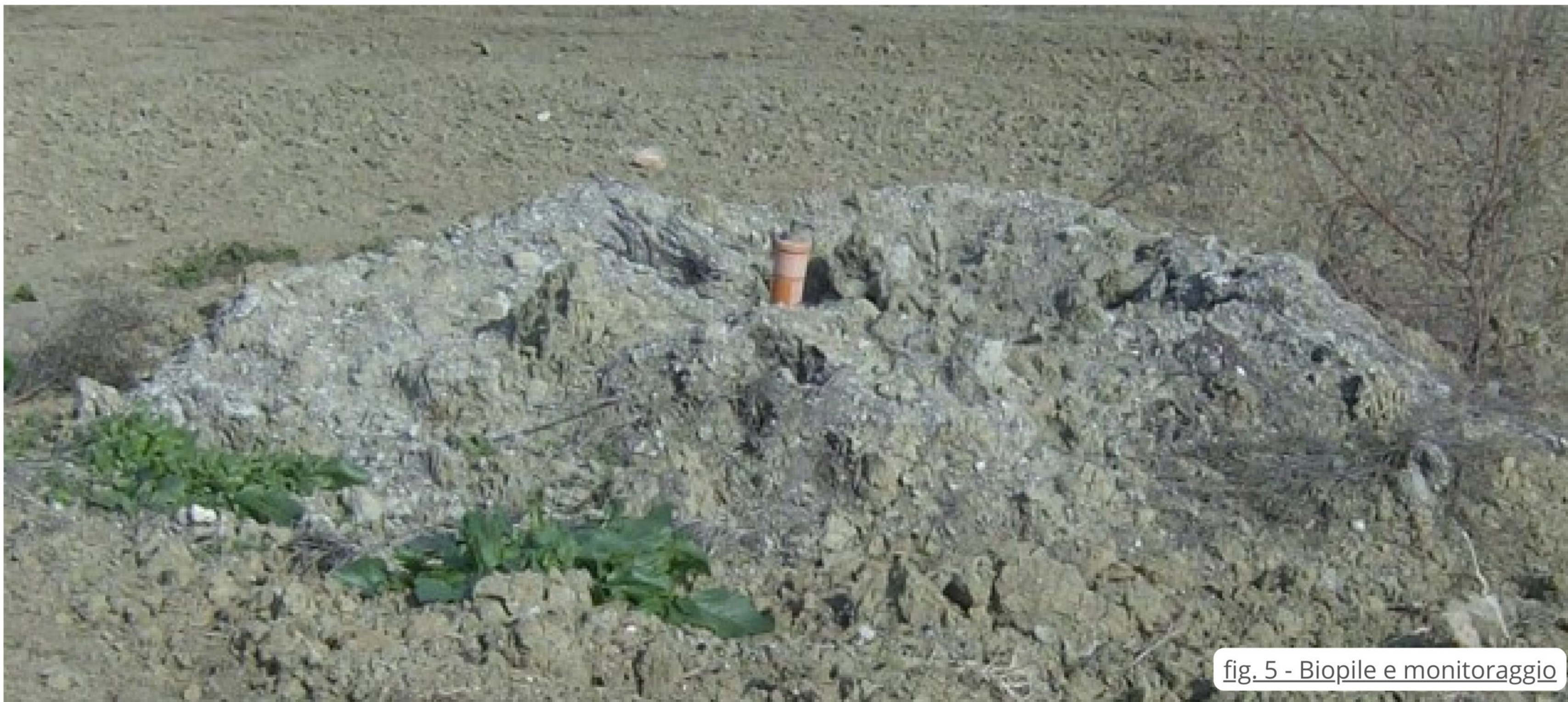
fig. 5 - Biopile e monitoraggio