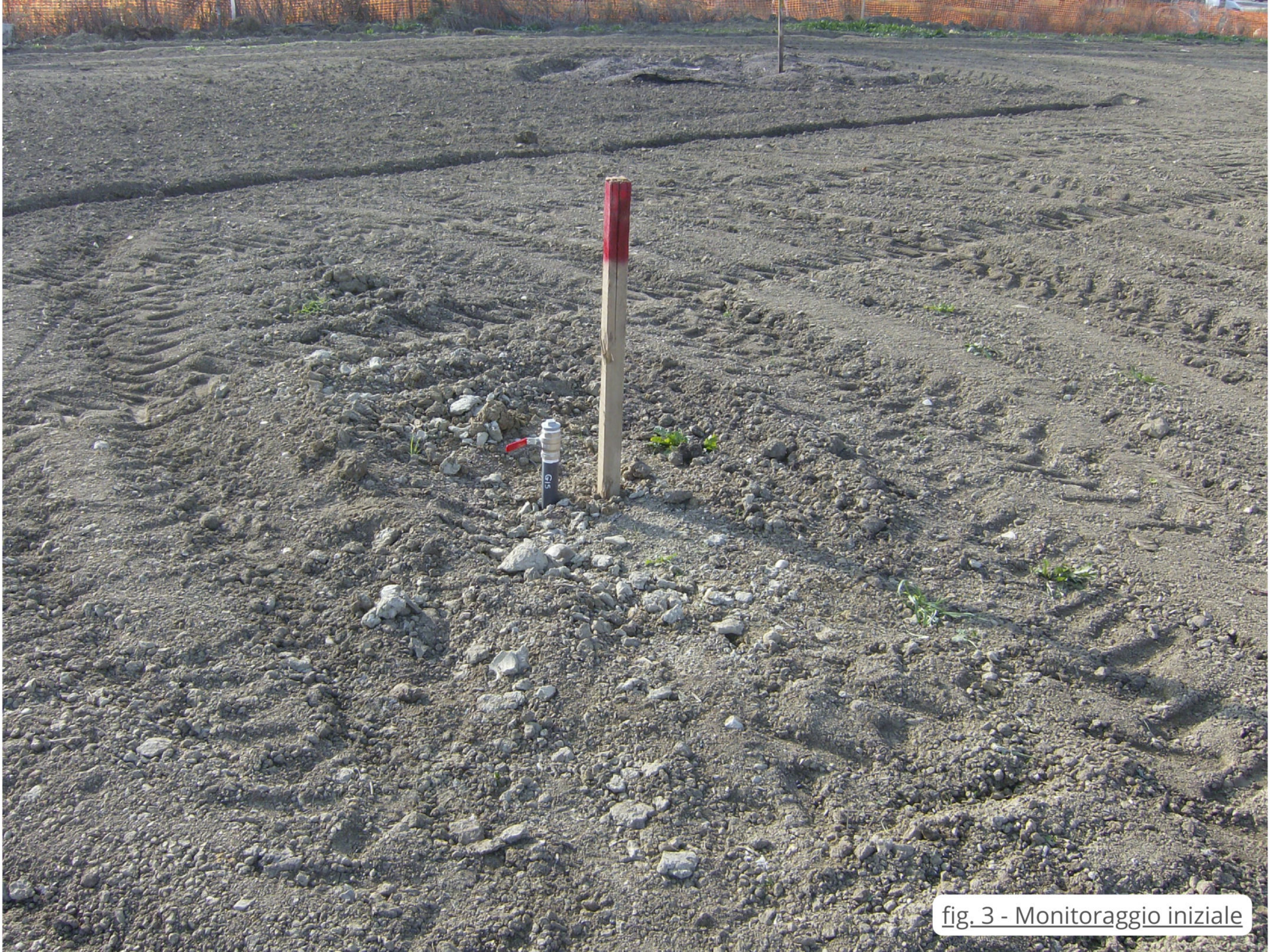
fig. 3 - Monitoraggio iniziale