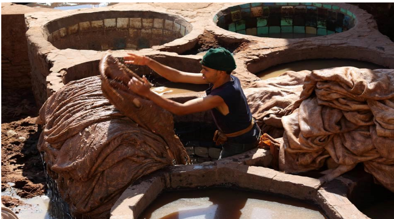
(Fes – conerie)