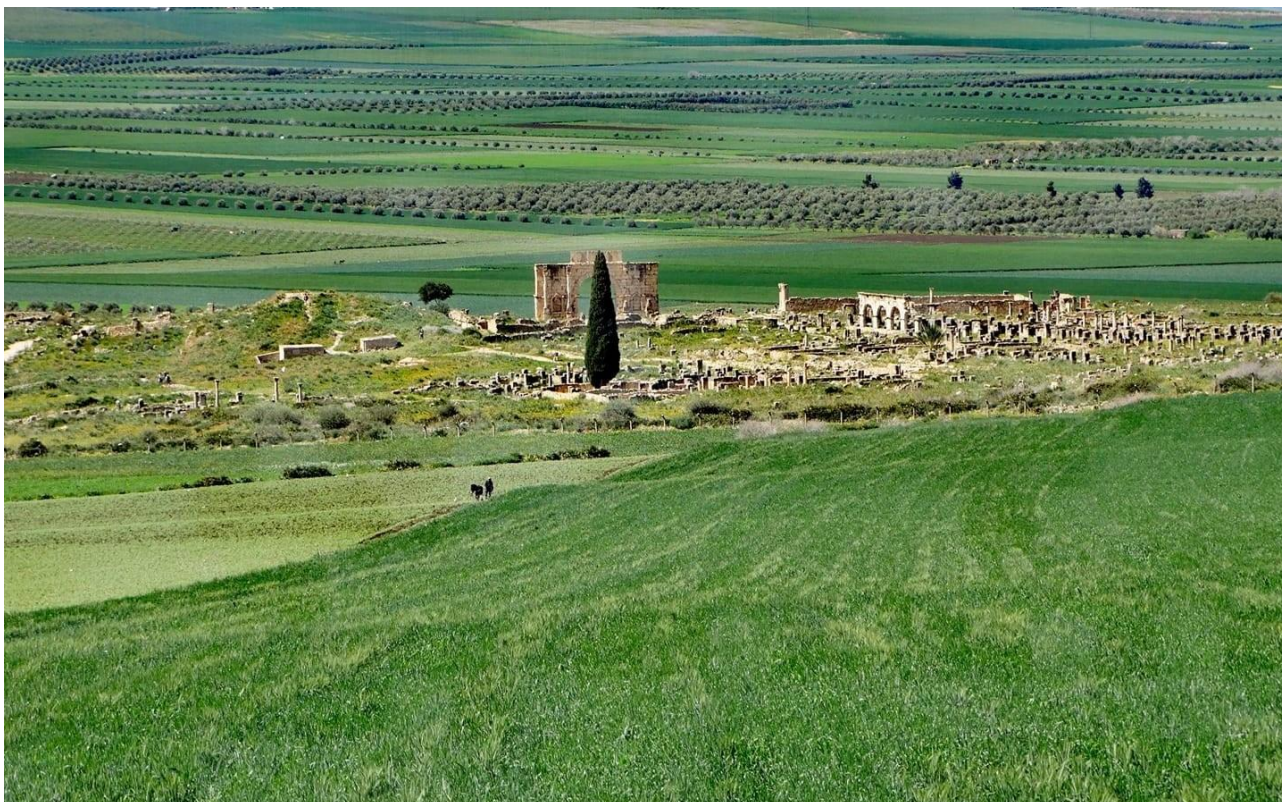
(Mausoleo Moulays Ismail – Meknes)

5° giorno (10/05/2023) : Chefchaouen » Volubilis » Meknes » Fes