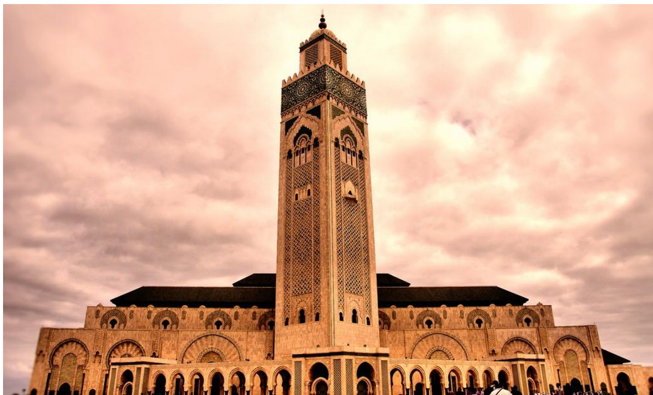
(Moschea Hassan II – Casablanca)