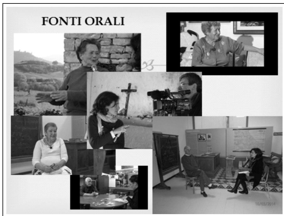
Figura 1 – Momenti durante la campagna di interviste a maestri e alunni delle scuole rurali.

Una peculiarità di questo lavoro è stata inoltre la campagna di sopralluoghi realizzati nelle zone rurali molisane che ha permesso di rintracciare dal vivo una ricca rete di strutture scolastiche rurali ormai in abbandono (in alcuni casi veri e propri ruderi).