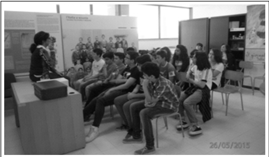
Figura 5 – Laboratorio “La valigia del maestro rurale” presso il Museo della scuola.

c) La terza attività è stata costituita da un laboratorio di ascolto e interpretazione delle fonti orali dal titolo «La valigia del maestro rurale» realizzato nuovamente presso il Museo della scuola. Essa ha concentrato la sua attenzione sull'uso delle fonti orali intrecciate a oggetti semiofori . Il laboratorio si è basato sull'espedito del ritrovamento presso il deposito del Museo di una valigia di un maestro di campagna di cui i ragazzi sono stati chiamati a svelare l'identità.