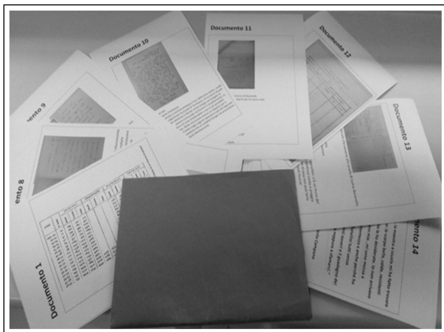
Figura 3 – Fascicolo dello storico con 26 documenti trattati didatticamente.

I ragazzi hanno poi partecipato a un vero e proprio gioco sulla plancia, ideato come percorso, che ha previsto lo spostamento delle pedine. Attraverso il lancio del dado e la risposta a quesiti storici e la pesca di “carte imprevisi” con calamità tipiche dell’epoca e della vita contadina, gli alunni sono stati guidati in un viaggio nel tempo attraverso una forte immedesimazione nell’epoca trattata. Parte del gioco è stato anche l’uso delle “carte informazioni” che hanno fornito maggiori notizie ai giocatori; fondamentali anche le “carte dello storico” che hanno aperto interrogativi la cui risposta era custodita nella corretta lettura e interpretazione delle fonti in possesso dei giocatori all’interno del fascicolo dello storico.