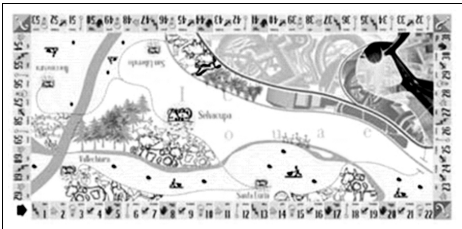
Figura 2 – plancia del gioco "Piccoli rurali in ... formazione".

In una prima fase sono stati forniti i documenti attraverso i quali si è svelata l'appartenenza dei giocatori a una scuola rurale del territorio molisano.