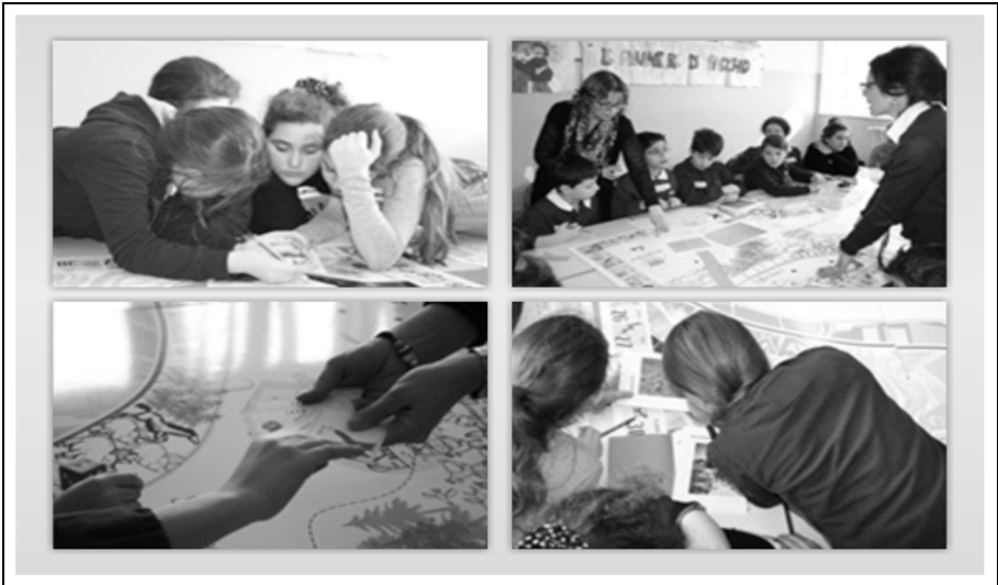
Figura 4 – Momenti della didattica ludica in aula.

c) La terza attività è stata costituita da un laboratorio di ascolto e interpretazione delle fonti orali dal titolo «La valigia del maestro rurale» realizzato nuovamente presso il Museo della scuola. Essa ha concentrato la sua attenzione sull'uso delle fonti orali intrecciate a oggetti semiofori . Il laboratorio si è basato sull'espedito del ritrovamento presso il deposito del Museo di una valigia di un maestro di campagna di cui i ragazzi sono stati chiamati a svelare l'identità.