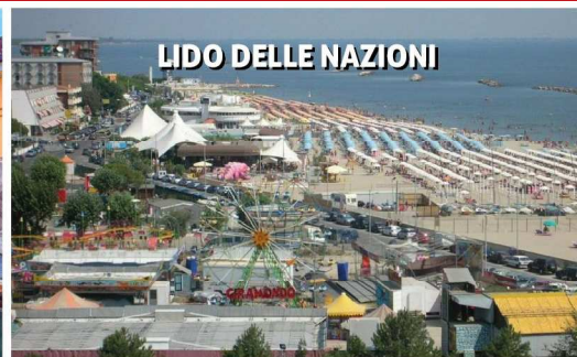
LIDO DELLE NAZIONI