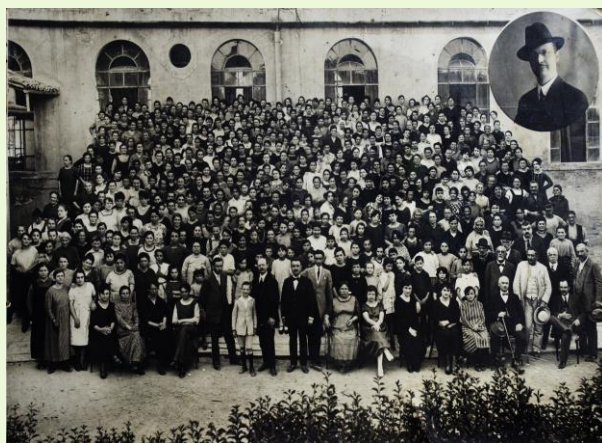
Fotografia del gruppo

Mi rivolsi all'addetto alla sorveglianza che s'apprestava a chiudere il portone dietro gli ultimi visitatori chiedendogli maggiori ragguagli circa la foto, ricevendo con cortesia e sollecita disponibilità diverse informazioni.