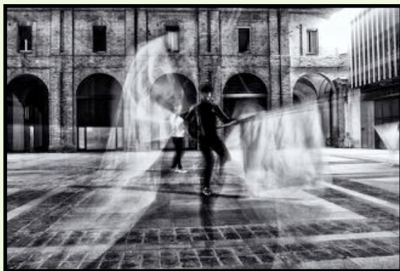
MIGLIOR FOTO SPORTIVA O DI MOVIMENTO Andrea Severi