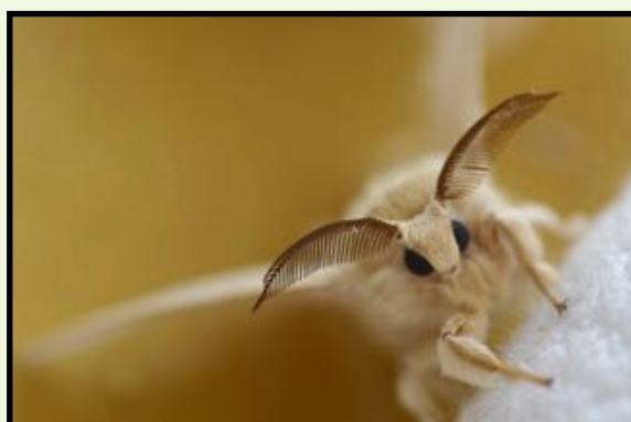
SEGNALATO "FILI DI SETA" Veruska Piazza