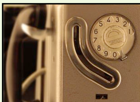
TELEFONI Loredana Lega