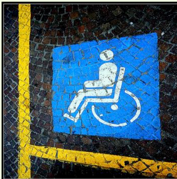
PRIMO PREMIO "SEGNALETICA ORIZZONTALE" Ugo Mazzoni