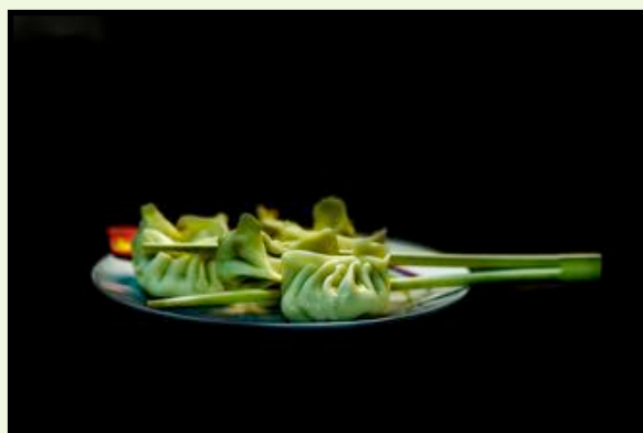
CIBO Ilice Monti