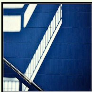
MIGLIOR FOTO CREATIVA Ugo Mazzoni