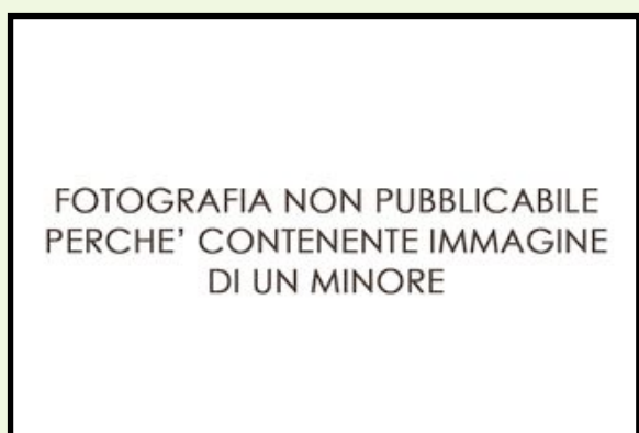
AMORE Ilice Monti