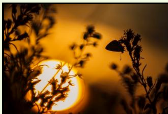
MIGLIOR FOTO NATURALISTICA Matteo De Maria