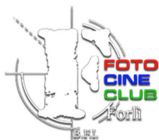
FOTO CINE CLUB FORLÌ

VIA ANGELONI 50 - FORLÌ fotocineclubforli@gmail.com http://fotocineclubforli.wordpress.com